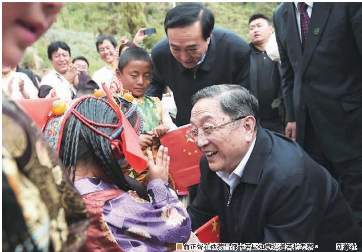
俞正聲在西藏昌都卡若區如意鄉達若村考察。

談及長期關注的扶貧問題，俞正聲指出，要突出精準扶貧、精準脫貧，扎實解決導致貧困發生的關鍵問題，優化扶貧資源配置，確保貧困人口如期全部脫貧。他並指出，要大力實施經濟援藏、教育援藏、就業援藏、科技援藏、幹部人才援藏，進一步完善全方位、多層次、寬領域的對