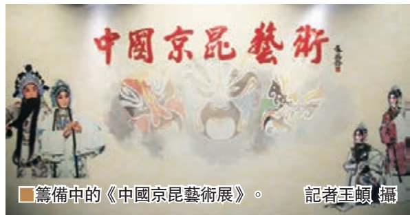
籌備中的《中國京昆藝術展》。