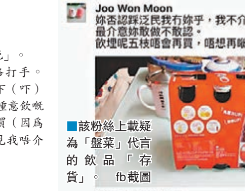
該粉絲上載疑為「盤菜」代言的飲品「存貨」。

（畀）講我就唔俾（畀）講，唔理堆真係會死。」一堆菜粉即時質疑對方是公民黨的網絡打手。「Joo Won Moon」還擊道：「當我打手呢下（吓）好搞笑，我like咗盤菜已經好耐，仲唔係好鍾意飲嘅奧樂蜜C（『盤菜』代言的健康飲品）都照買（因為太甜）。大家都係支持民主嘅人，唔同意見我唔介意，我最唔鍾意係做嘢唔敢認人。」 踩公民黨「成功趕客」 「盤菜」就乘機賣廣告，「我好多謝你支持，問題係我唔明白自己唔敢認d（啲）乜sosad，你會唔會係太大壓力，不如飲多啲奧樂蜜C下一下火，我根本冇捉人任何痛腳。」不過，「Joo Won Moon」其後就上傳了疑為其家中該牌子健康飲品的「存貨」，稱「妳否認踩『泛民』我有妳手（符），我不介意妳踩『泛民』，我最介意妳敢做不敢認。飲埋呢五枝（支）會唔再買，唔想再啱時間，拜拜。」 「盤菜」則留言稱，「你唔鍾意飲我都無謂逼你買，拜拜！」 「Joo Won Moon」不久在留言區「失蹤」，「盤