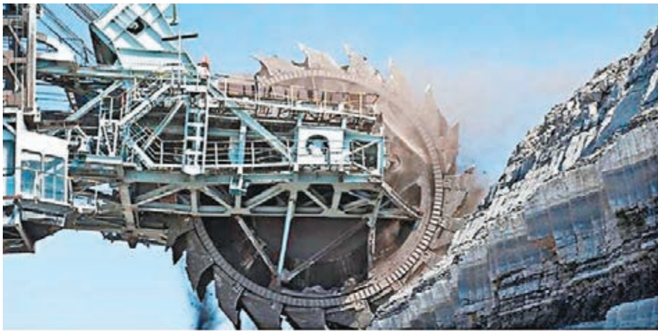
全球原物料需求改善,帶動工業金屬、鐵礦石資源價格上揚。圖為鐵礦石開採。資料圖片

近年走勢低迷的原物料市場,今年來表現相對亮眼,也帶動原物料相關基金漲勢。復華投信表示,隨着市場供需改善,加上機構投資者預測美國加息腳步放慢,減弱美元對原物料報價的殺傷力,對原物料中期看法仍偏好,建議可透過全球資源型基金佈局。