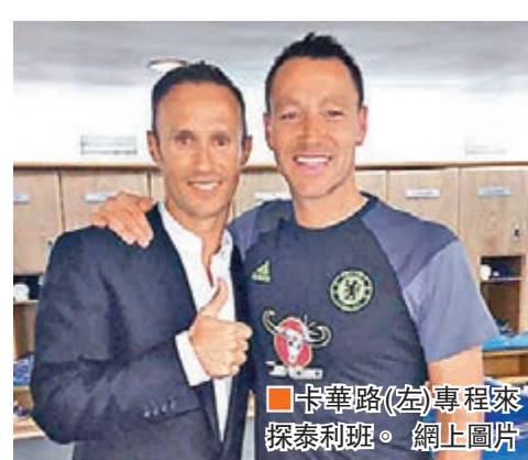
卡華路(左)專程來探泰利班。網上圖片