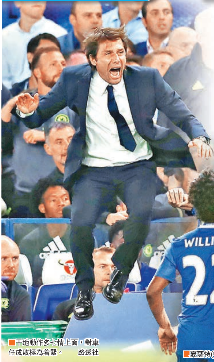
干地動作多七情上面，對車仔成敗極為著緊。

即使上半場兩軍顆粒無收，但比賽形勢在換邊後即起着相當變化，先是夏薩特於下半場2分鐘轟入12碼，但到33分鐘客隊後衛占士哥連斯扳回一城追平。 眼見全取3分無望之際，迪亞高哥斯達在完場前一分鐘接應新加盟的比利時中場巴舒亞伊的頭槌，一腳射入為車仔再度領先。干地見狀即興奮莫名，和身邊的教練團與球迷擁抱起來，投入程度可媲美另一激情教頭、利物浦的高洛普。