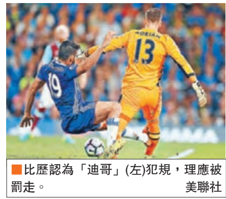
比歷認為「迪哥」(左)犯規，理應被罰走。