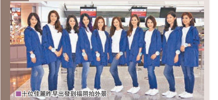
十位佳麗昨早出發到福岡拍外景。