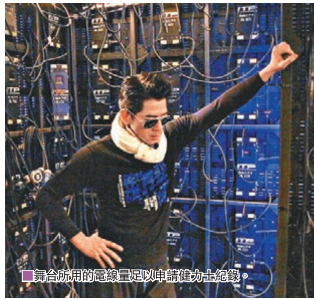
舞台所用的電線量足以申請健力士紀錄。