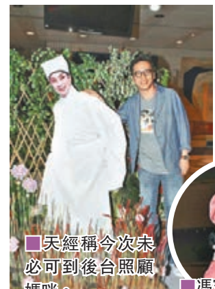
天經稱今次未必可到後台照顧媽咪。

天經表示首次公演時他已看足20場，唯今次自己要排練舞台劇，故未必可以來後台照顧媽咪。天經透露早前跟一班演員合組劇團，合夥投資辦舞台劇《七十二家房客》，是緊接媽咪的檔期，定於8月底在文化中心舉行，媽咪也可以來捧場給他意見。問有否邀請媽咪客串演出？天經指媽咪要全力演出粵劇已經很累，故也不敢勞煩她，不過要是她覺得好玩，自薦演出也說不定的。