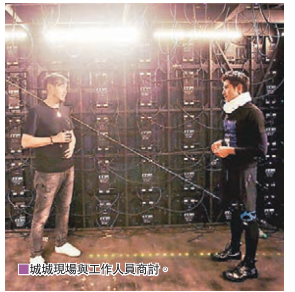
城城現場與工作人員商討。