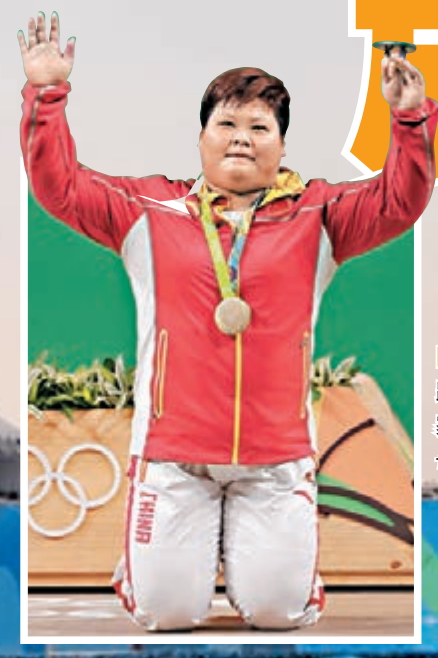
■孟蘇平賽後跪地感謝國家、感謝父母。