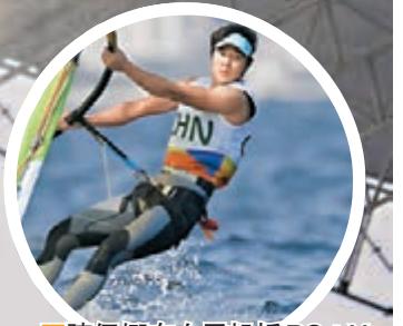
■陳佩娜在女子帆板RS:X級比賽奪銀。