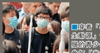
穿著「學生動源」制服的青少年參加「光復上水」行動。