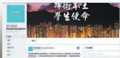
學生動源 Studentlocalism。fb 截圖