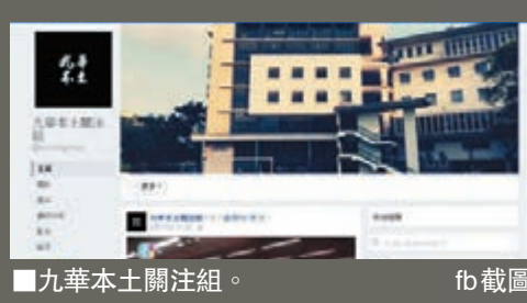
九華本土關注組。fb 截圖