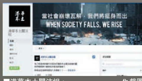
港華本土關注組。fb 截圖