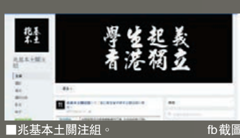
兆基本土關注組。fb 截圖