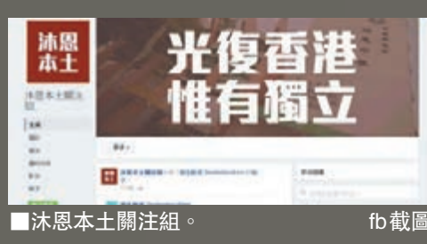
沐恩本土關注組。fb 截圖