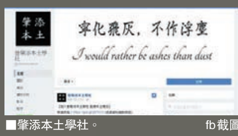
攀添本土學社。fb 截圖