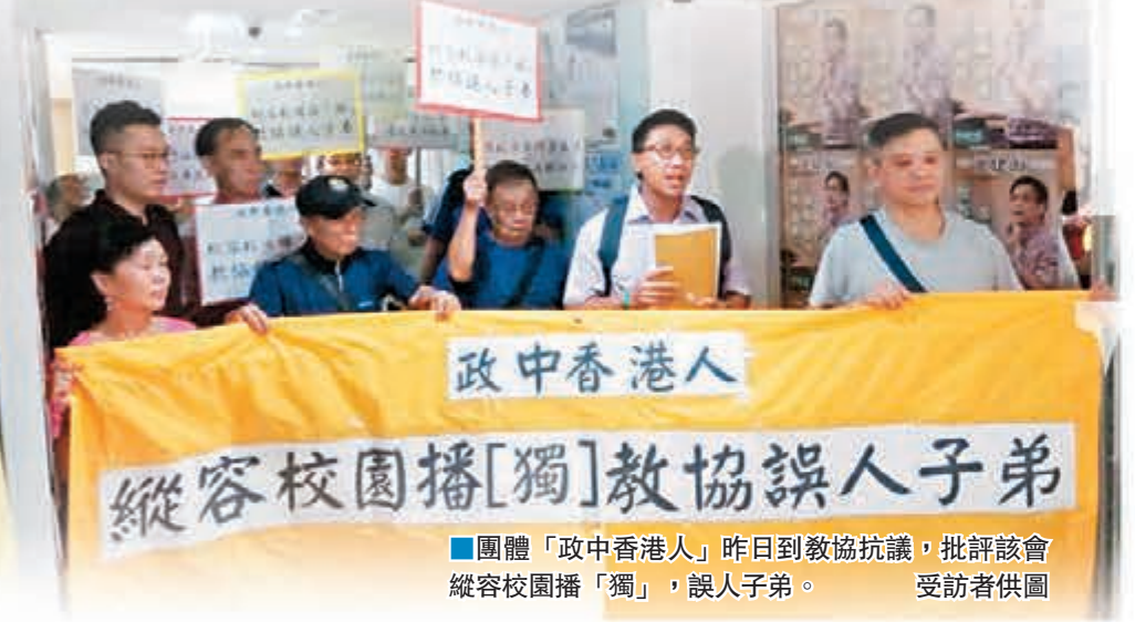
團體「政中香港人」昨日到教協抗議,批評該會縱容校園播「獨」,誤人子弟。