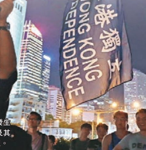
被質疑有金主「無咩好澄清」