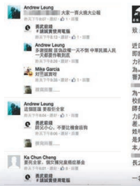
激進組織致函幼稚園校長，要求開除該記者女兒的學籍。