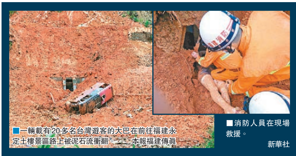
■一輛載有20多名台灣遊客的大巴在前往福建永定土樓景區路上被泥石流衝翻。 ■消防人員在現場救援。

香港文匯報訊(記者 何德花 福州綜合報導)昨日上午10時30分,福建省龍岩市永定區湖坑鎮新南村路段突發山體滑坡,一輛載有21名台灣遊客的大巴車行經此處被泥石流衝翻,造成1名50歲的葉姓台籍女遊客死亡、2人重傷、9人輕傷。所有傷員已送醫救治。事故發生後,國台辦、國家旅遊局等有關部門高度重視,指導有關方面做好善後。福建省迅即啟動突發事件應急處理機制,成立事故處理小組並派專人趕赴事故現場,全力開展善後工作。海峽兩岸旅遊交流協會已向台灣方面通報了有關情況。