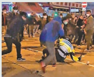
「旺暴」之夜，暴民將警員打倒在地。