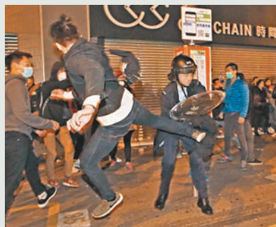
旺角暴徒飛腳襲警。