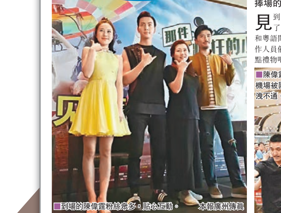
陳偉霆近期因為「佛爺」一角人氣大熱。