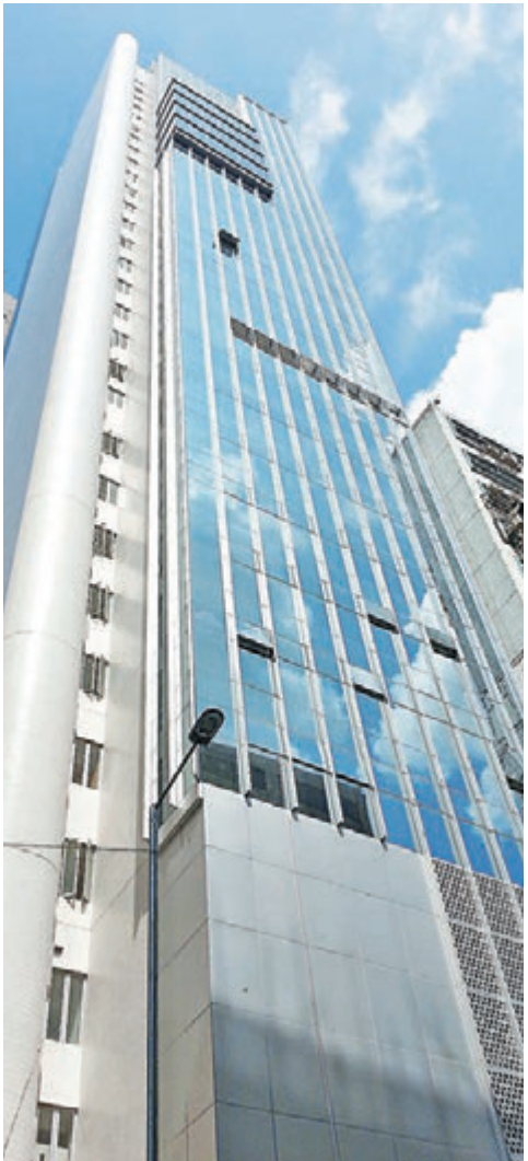
政府加強巡查工廈用途後，觀塘區內租賃個案明顯下跌。

香港文匯報訊(記者 蘇洪鏞)近期多宗工廈火警及政府加強巡查工廈用途等，皆打擊投資者入市意慾，市場觀望氣氛濃厚。其中有不少樂隊租用作排練室及表演場地的觀塘及牛頭角一帶，近期租賃成交下跌，料本月僅錄約100宗租賃成交，按月勢急挫超過兩成。但有代理指，非正統工業用途未成租務市場主流，交投減少主因在於經濟環境轉弱，令企業凍結租用樓面步伐。