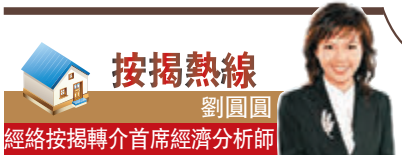
按揭熱線 劉國圓 經絡按揭轉介首席經濟分析師