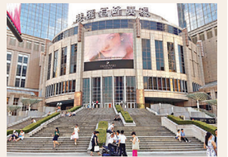
上海港匯恒隆將大變臉，原本的台階將被拆除。

業內稱，上海兩座恒隆商場選擇今年開始改造是明智之舉，可以有效提高競爭能力。另據服務商業地產的平台商表示，恒隆也希望借上海兩個項目的改造再豎招牌，旨在維護好上海兩座恒隆形象，也會對其他內地恒隆的品牌形象起到很大的幫助。