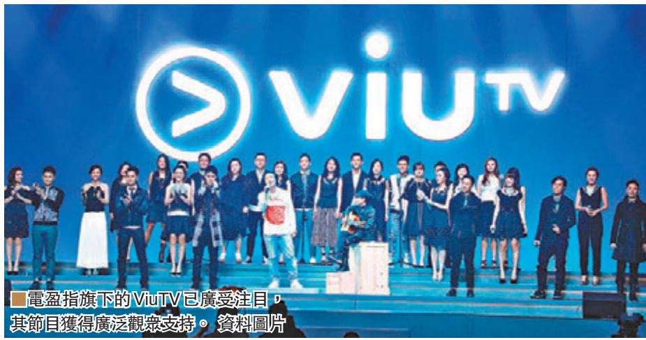
電盈旗下的ViuTV已廣受注目,其節目獲得廣泛觀眾支持。資料圖片

香港文匯報訊(記者 陳楚倩)電盈(0008)昨公佈中期業績,期內賺8.68億元,按年減少19%,每股基本盈利11.4仙,中期息派8.16仙。期內核心收益增加2%至184.09億元;計入盈大地產(0432)的綜合收益增加2%至185.24億元。