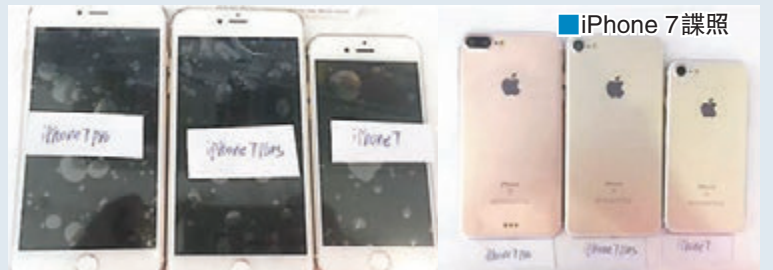
■iPhone 7 諜照

科技網站早前報道，蘋果公司擬於下月 16 日正式推出新一代手機 iPhone 7，外界估計，新產品會聯同開發已久的新版 MacBook Pro 手提電腦，率先於下月 6 日或 7 日舉行的發佈會上亮相。彭博通訊社前日引述消息人士透露，發佈會定於下月 7 日舉行，但新版 MacBook Pro 將不會於發佈會登場。蘋果發言人埃文斯拒絕回應傳聞。 ■彭博通訊社/bgr 網站