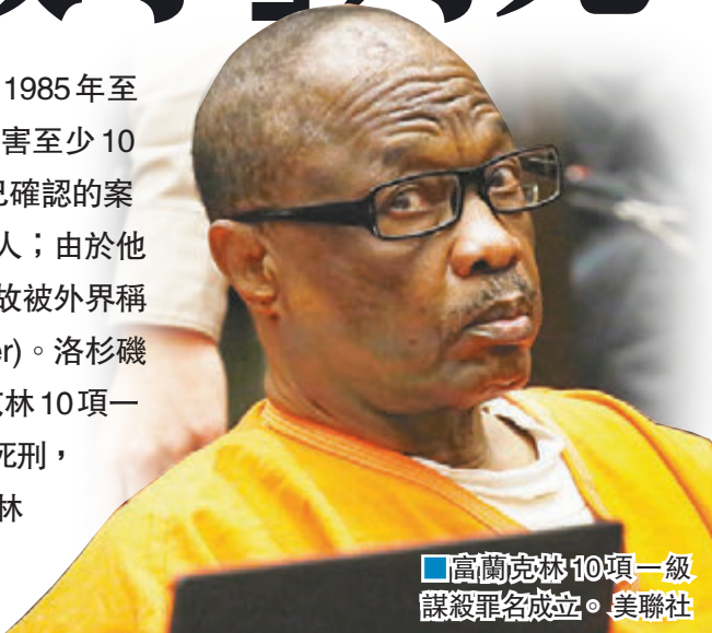
■富蘭克林10項一級謀殺罪名成立。

美國 63 歲男子富蘭克林在 1985 年至 2007 年間，於洛杉磯南部殺害至少 10 名非裔女性，警方估計除了已確認的案外，受害者可能多達 25 人；由於他曾銷聲匿跡 14 年後再犯案，故被外界稱為「沉睡殺手」(Grim Sleeper)。洛杉磯高等法院今年 5 月裁定富蘭克林 10 項一級謀殺罪名成立，前日判處他死刑，法官肯尼迪在庭上斥責富蘭克林是罪無可恕的「魔鬼」及「變態施虐狂」。