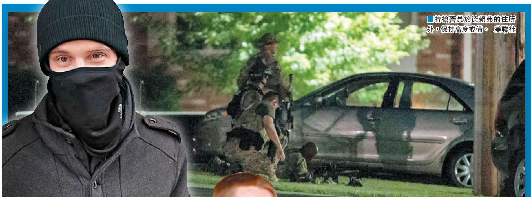
持槍警員於德賴弗的住所外，保持高度戒備。

加拿大一名支持極端組織「伊斯蘭國」(ISIS)的24歲青年，密謀在大城市和人流密集的公共場所引爆身上炸彈，發動「獨狼」自殺式恐襲。警方前日派員包圍他的住所，疑犯在對峙期間引爆炸彈，傷及自己和另外一人，在試圖引爆第二枚炸彈之前被警員擊斃。警方採取行動前，向多倫多公車局(TTC)和長途列車GO發通知，呼籲警惕與此案相關的安全威脅。安保部門與總理杜魯多開會討論後，相信公共安全未受威脅，維持恐襲警戒級別在「中等」。