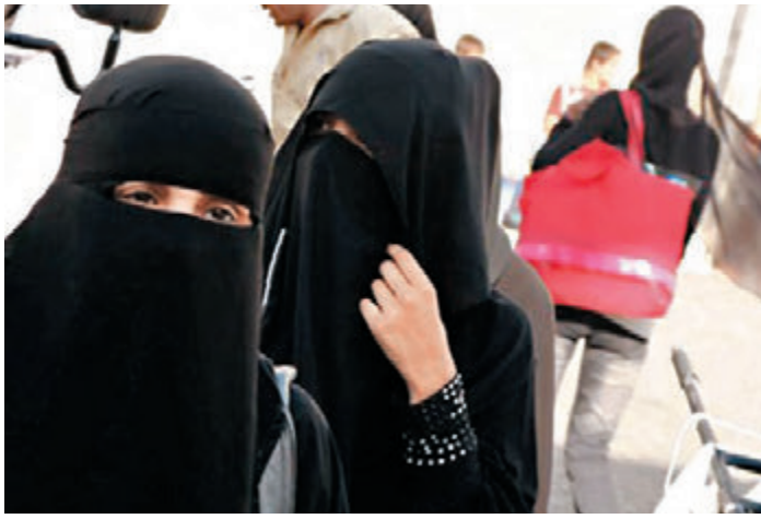
對於政客要求禁止穆斯林戴面紗，內政部長稱這不在考慮之列。資料圖片