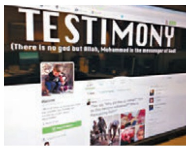
德賴弗曾於網上散播極端言論。