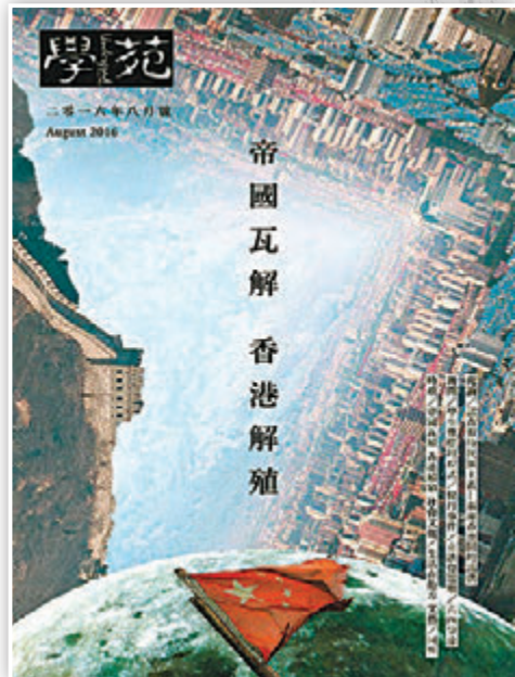
8月號《學苑》煽動暴力以至鼓吹「港獨」，與公民黨「教壞人」不無關係。《學苑》截圖

香港文匯報訊（記者 甘瑜）各大專院校部分激進學生煽「獨」情況越來越猖獗，其中香港大學學生會刊物《學苑》更是越來越明目張膽，將國家政權倒台與「港獨」相聯繫，公然宣揚顛覆國家。公民黨前主席陳家洛，被本報揭發曾發表疑似煽「獨」的言論，更經常在課堂上要學生想像「五星紅旗升不起」等情況。有教育界人士批評，公民黨相關人等透過課堂上播「獨」，及在課堂外煽動學生作出激進行為，令學界「獨」風及激進行為問題越來越嚴重，可謂是「港獨」的始作俑者。