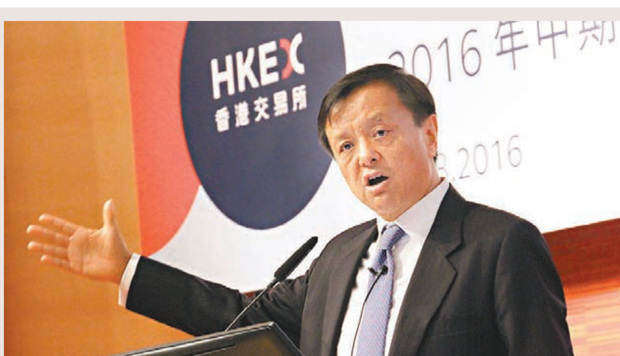
港交所戰略計劃最新進展

港交所上半年現貨業務收入跌32%至12.8億元，結算、商品、股本證券及金融衍生產品的收入跌幅分別為20%、9%及3%，但期交所的衍生產品合約成交則升34%，創出半年度最高紀錄。