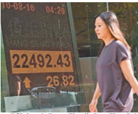
■港股昨一度升152點，收升26點，成交612.5億元。

亦有不少大藍籌遭到拋售，港鐵(0066)中期業績雖符合預期，但沙中線造價被大行詬病，收報41.90元跌3.68%。九龍倉集團(0004)收報52.20元跌1.88%，港交所(0388)跌近1%。