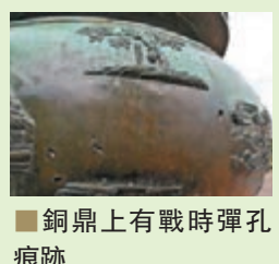
■銅鼎上有戰時彈孔痕跡