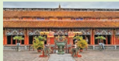
■這裡便是各皇帝像身處之地，進去後不可拍攝。