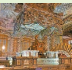
■啓成殿內一室以碎瓷手工製作