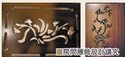
■房間雕飾設計講究

由於順化是越南古都，所以地方文化較為簡樸，而酒店都是以簡單建築為主，今次筆者下榻的帝王酒店，從外觀看似是一座簡單的建築物，但原來走進房間，你卻發現藏有不少藝術元素，如衣櫃、洗手間的門上都有通心雕刻，而大堂的柱狀建築亦富雕飾。