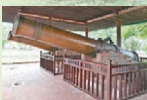
■穿過古城牆後，銅炮就在右邊。