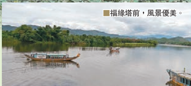
■福緣塔前，風景優美。