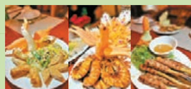
■越式美食，伴碟雕刻精緻。