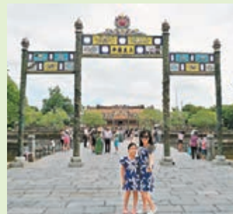
■午門後，太和殿就在眼前。