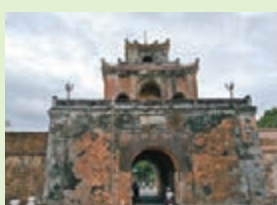
■進皇城前，先經這座古城牆。

早前筆者一天內遊覽了這三個古蹟，其中有些建築物更融合了越南、法國及中國的建築特色，現在筆者就帶領大家走進去參觀。