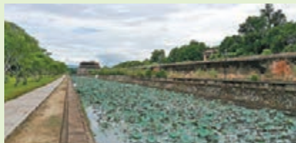
■皇城内蓮花處處，這條路是筆者離開皇城回望的美景。