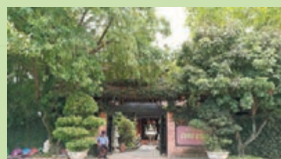
■Royal Park Restaurant

來到順化，當然要品嚐越式地道美食，這兒的美食原來都很講究，筆者今次就到了一間名為Royal Park Restaurant的餐廳，餐廳格局如同皇室一樣，氣派不凡，而品嚐的當然是地道的越式美食，當中如越式拼盤、香茅炸蝦、越式扎肉等，但最特別的不是美食，反而是其上菜一刻，其精雕細琢的伴碟卻吸引筆者目光，然後就相機先食了。