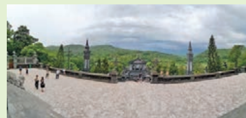
■啓定陵風水格局：左青龍，右白虎。

皇陵內，可看到弘宗捨棄金銀，一室以碎瓷手工製作的牆飾，精緻又不俗氣，當中還有富中國特色的梅蘭菊竹，堆砌得極形似。而殿外還可遠眺山景和觀音像，據悉是收左青龍、右白虎的風水格局，縱使要爬百幾級石梯，也十分值得一看。