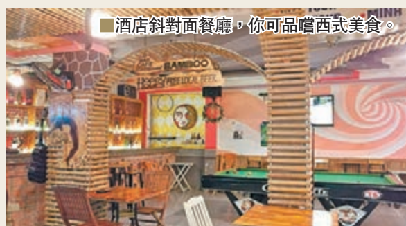
■酒店斜對面餐廳，你可品嚐西式美食。

當然，這間酒店附近有幾間餐廳，都開得頗夜，如肚子餓了，或想喝越南啤酒，酒店斜對面正有間餐廳，吃的是Pizza，更是買二送一，味道不錯。至於越南啤酒，更是買一送一，如大家想在睡前把酒談歡，住在這兒的確不錯。