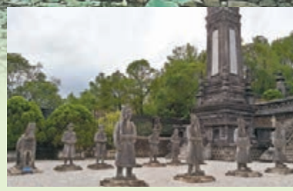
■啓定陵兩旁，有兵馬俑守護。