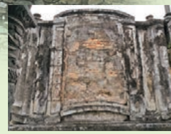
■這座牆壁後是啓定陵墓位置。