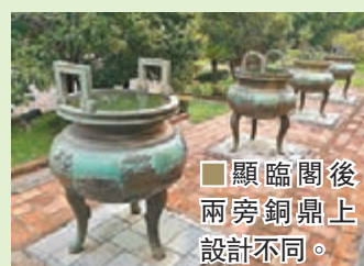
■顯臨閣後兩旁銅鼎上設計不同。

當天，筆者採取不走回頭路遊覽，先由古城牆進入，發現城牆外種滿了蓮花，非常美麗，然後沿路看到銅炮古蹟，再經過大片綠草，環境非常寬廣。走了一段路後，終於來到皇城的正殿。由於早年越南是中國的從屬國，到18、19世紀又受法國人統治，所以皇城建築亦有中法元素，例如選址依着香江而建，背有恩古平山作靠山，以至建築用色，都參考了中國五行五色和風水學說，故有北京紫禁城之稱。在這兒遊覽，可遊足兩小時，藉此感受古皇朝文化氣息。