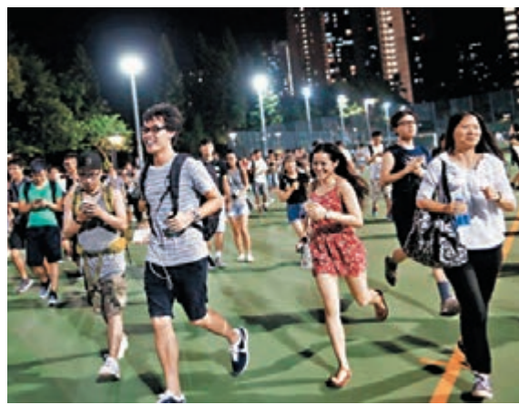
網絡遊戲風靡，在一定程度上而言，誰能贏得網絡輿論，誰就掌握了致勝寶笈。

政治選舉需要注重理念，要為香港的未來貢獻智慧。政治選舉也要用好互聯網，懂得網絡，善用網絡，成功離你不遠。