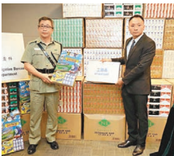
海關簡報破獲懷疑私煙經過。

海關相信不法分子的走私形式已由「螞蟻搬家」轉為大量運送,以逃避追查,並以快速散播模式散貨。海關重申,走私屬嚴重罪行,違例者最高可判罰款200萬元及監禁7年。