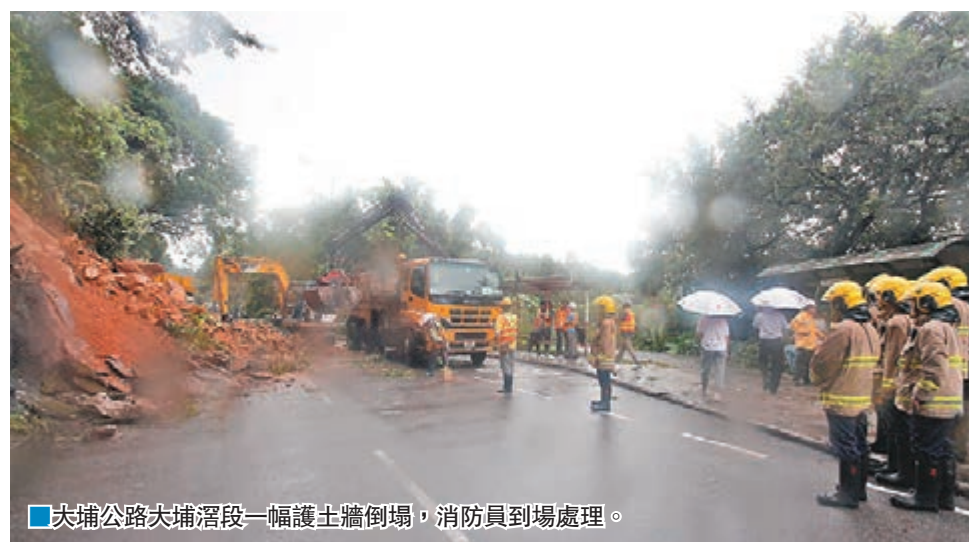
大埔公路大埔滘段一幅護土牆倒塌,消防員到場處理。