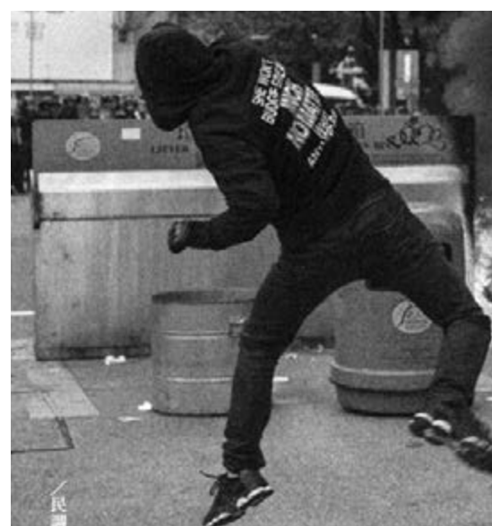
8月號《學苑》繼續發表煽動暴力以至「港獨」言論,以暴力縱火的畫面切入所謂的網上「民調」結果。