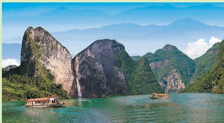
■靈秀野三河