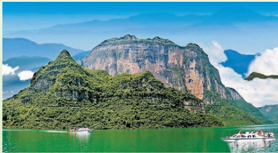
■景陽河畫廊