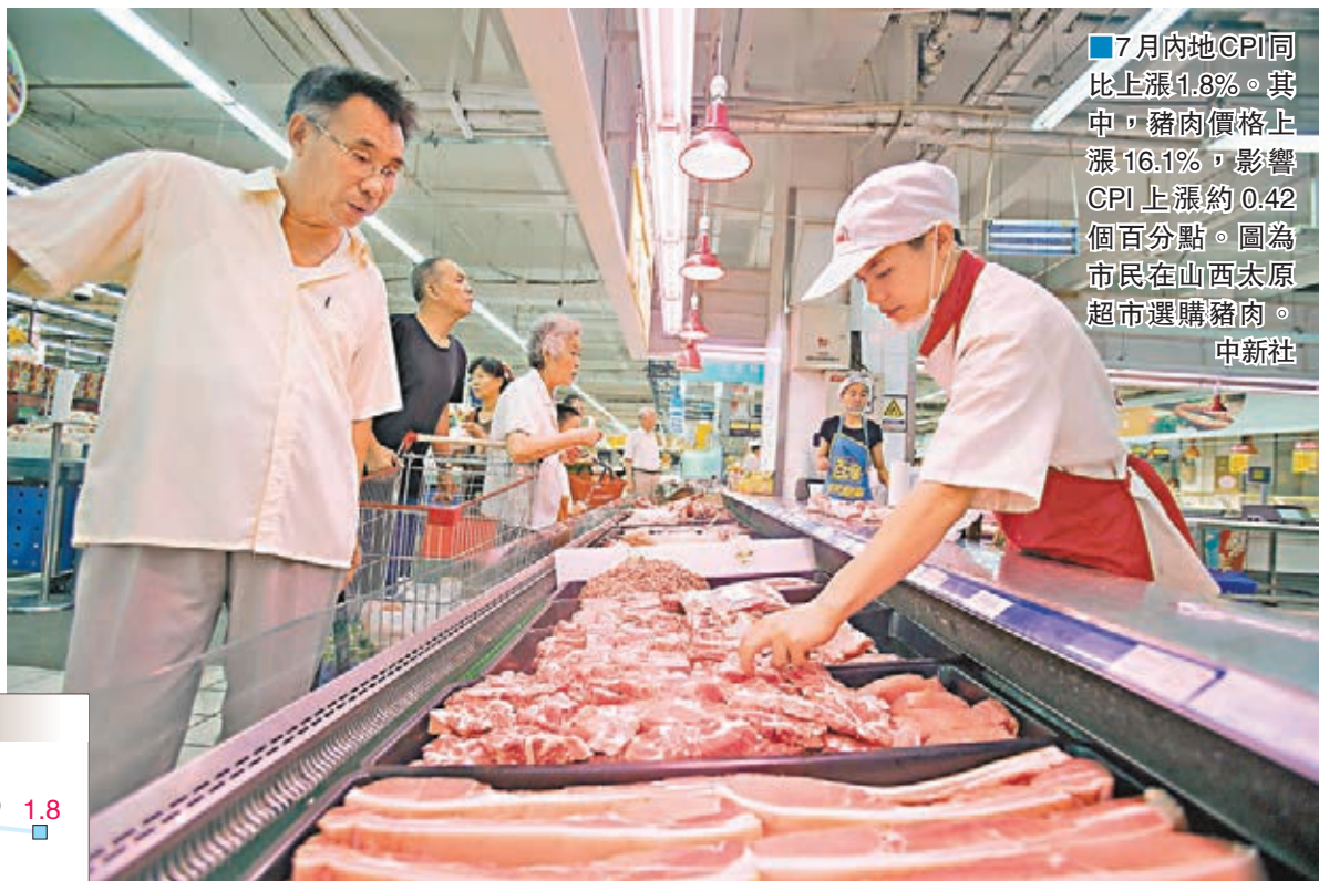
7月內地CPI同比上漲1.8%。其中,豬肉價格上漲16.1%,影響CPI上漲約0.42個百分點。圖為市民在山西太原超市選購豬肉。

香港文匯報訊(記者海巖北京報道)國家統計局昨日公佈最新數據顯示,7月內地消費者物價指數(CPI)同比增長1.8%,連續三個月走低並降至年內新低,但服務業價格加速上漲帶動CPI環比轉正,升至0.2%。當月工業品出廠價格(PPI)同比降幅連續七個月收窄至1.7%,為近兩年來最小降幅。專家預計,7、8月將是年內物價低點,而PPI亦有望在持續負增長近五年後於年底前轉正。