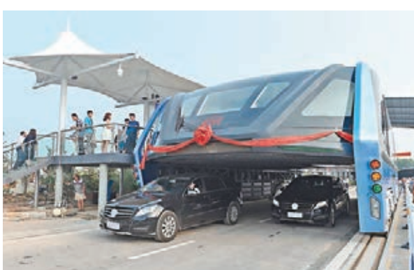
巴鐵1號試驗車本月初駛出工作棚進行路面測試,引起關注。

一個月,「巴鐵」從今創集團的生產廠區內下線後,引來各界關注。如今,今創集團高層和廠區保安均對「巴鐵」三緘其口。該集團負責宣傳的一位王姓部長稱,對於「巴鐵」,今創集團不接任何採訪。不過,她亦表示,「巴鐵」只是集團接到的一個訂單,目前「巴鐵」和今創沒有任何關係。