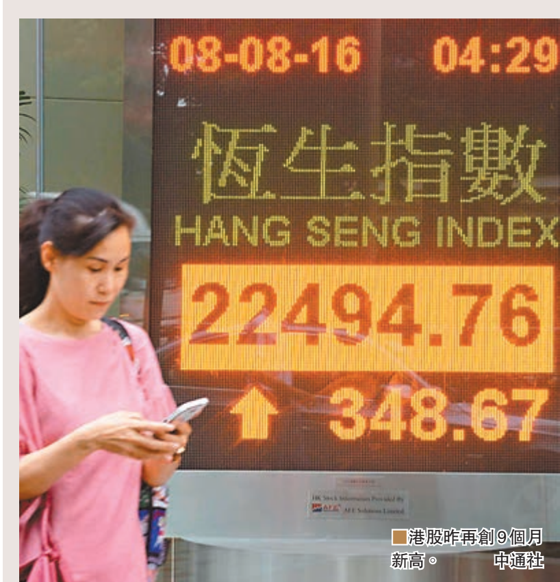
港股昨再創9個月新高。中通訊

剛被市場視為「妖股」的德普(3823), 續被沽空機構「狙擊」、大股東股份被斬後, 昨日更發盈警兼配股, 令該股經4日輕微反彈後, 昨日再跌6.7%。德普發盈警指出, 該公司計劃以每股0.25元, 即較上周五收市價折讓近17%配股, 集資逾6億元。同時, 該公司建議透過額外增設120億股, 將公司法定股本由80億股增至200億股。