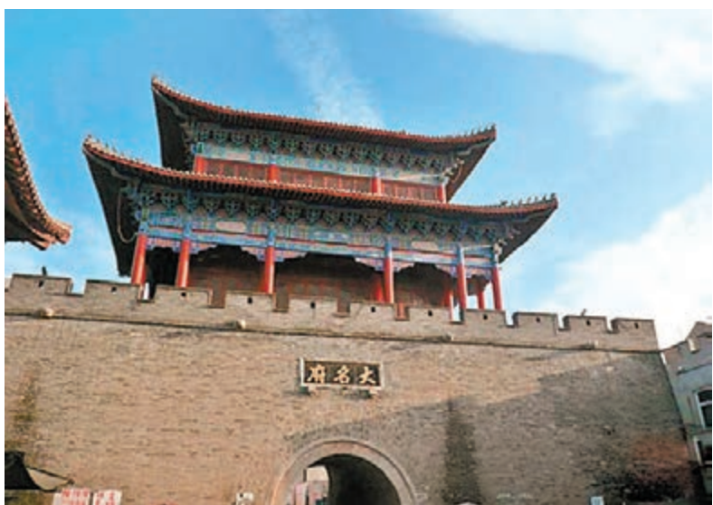
■臥虎藏龍的大名府，千古風流人物數之不盡。網上圖片製造假象，誘其就範，取得了桂陵之戰和馬陵之戰的勝利，為中國戰爭史上「設伏殲敵」的著名戰例。大名還是寫《論衡》的東漢思想家王充、西晉學者、文學家東晉的故鄉，蘇轍、歐陽修、包拯皆曾在此當官。大名府也先後建有多家書院：元城書院、天雄書院、大名書院、貴鄉書院、廣晉書院等。

機緣巧合，8周年後的5月12日又抵鄭州，隔一天才換乘大巴自安海到邯鄲。陽光下流着汗水的解放軍整齊的步伐真好看，思考着要如何向他們致敬時，他們卻鳴鼓收兵，列隊小跑步離開了。台階上突然出現四個攝影家，對着我們拍照，我拿起手機，記錄下他們認真的身影。博物館裡有餘時間不足，只能匆匆走一趟，原來公元前45年至公元23年的王莽，中國歷史上新朝的建立者，是在大名當皇帝。名留千古因敢於進行社會改革，禁止買賣土地和奴婢，改革工商業、稅制等措施。戰國初期著名軍事家孫臏，和龐涓同拜於鬼谷子門下，因才華過高，遭妒忌他的龐涓不顧同學情誼，捏造罪名使被處以膾刑（砍去雙足）和黥刑（在臉上刺字）。後來孫臏在齊國輔佐田忌將軍，運用「圍魏救趙」戰法，利用龐涓的弱點，