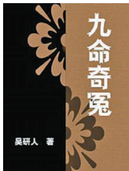
■這部小說，開了晚清讀者的眼界。歹徒，怎有這樣的對話？但在晚清作者提供小說界，已是奇花一枝了。

過，對話中還插有敘述句，如引文中的「碎骨碎骨」、「轟……」、「劈劈啪啪，一陣火星亂迸」。這又不錯，他《孽子》的對話，有論者便說寫得非常差。回頭再說說所引的《九命》對話，吳研人用說話來陳述事實，有點不合邏輯，在那殺人之夜，一眾作者提供小說界，已是奇花一枝了。