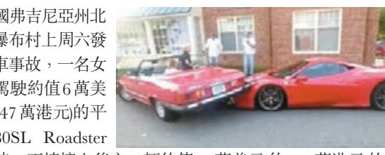
美國弗吉尼亞州北部大瀑布村上周末發生撞車事故，一名女司機駕駛約值6萬美元(約47萬港元)的平治380SL Roadster倒車時，不慎撞後方一輛約值30萬美元(約233萬港元)的法拉利458 Speciale跑車，平治整輛剷上法拉利車頭。雖然意外中無人受傷，但女司機荷包相信難免大出血。

有途人拍下事發經過上傳社交網站，發現愛車被撞的法拉利車主形容「這是我一生見過最蠢的事」。有網民揶揄這是場「階級鬥爭」，「中產的平治對上流的法拉利」。 ■《每日電訊報》