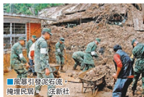
風暴引發泥石流，掩埋民居。 法新社

墨西哥中部普埃布拉州災情最嚴重，至少28人被山泥傾瀉活埋喪生，仍有多人失蹤，多條高速公路受破壞，至少2座橋倒塌，多處斷電。多處河水暴漲，沿岸居民要緊急疏散。州長巴列表示會盡快展開重建，又透過twitter分享視察災情及災民協助清理瓦礫的照片。 ■路透社/法新社