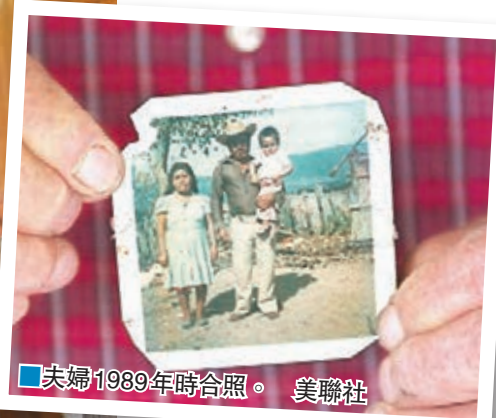
夫婦1939年時合照。