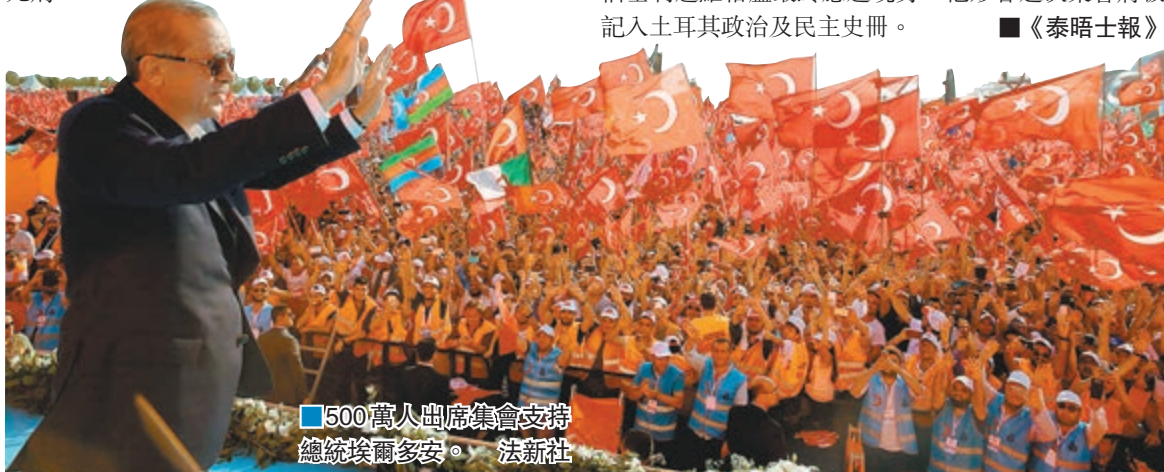
500萬人出席集會支持總統埃爾多安。

曾表示無意出席的主要反對黨共和人民黨(CHP)領袖基利達羅格盧最終應邀現身，他形容這次集會將被記入土耳其政治及民主史冊。 ■《泰晤士報》