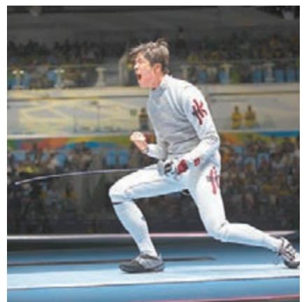
張家朗慶祝晉級16強。

完成奧運後，張家朗將於10月才展開新賽季，來季將以亞洲錦標賽和世界青少年錦標賽為目標。張家朗最後表示，自己現在最想回港盡快見家人：「終於可以放鬆，很久沒見過家人，希望可跟他們吃飯，也想跟教練及隊友慶祝。」