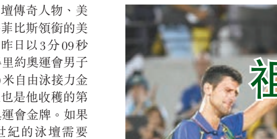
祖高域向球迷道別。

另外，菲比斯憑藉出色的發揮，收穫他個人第19枚奧運金牌。「飛魚」的右肩和背部有好幾個紫紅色印記，這些並不是什麼新型紋身，而是菲比斯「拔罐」之後留下的「痕跡」。據媒體報道，儘管有專家對拔罐的效果表示懷疑，但菲比斯採用這個手段進行治療已經有一段時間了。對於一個第五次參加奧運會的31歲老將來說，「拔罐」這門在中國廣受歡迎的手藝也許是菲比斯恢復體力的一個「秘技」。在隨後的比賽中，狀態不錯的菲比斯將向他個人第20枚奧運金牌發起衝擊。 記者 梁啟剛