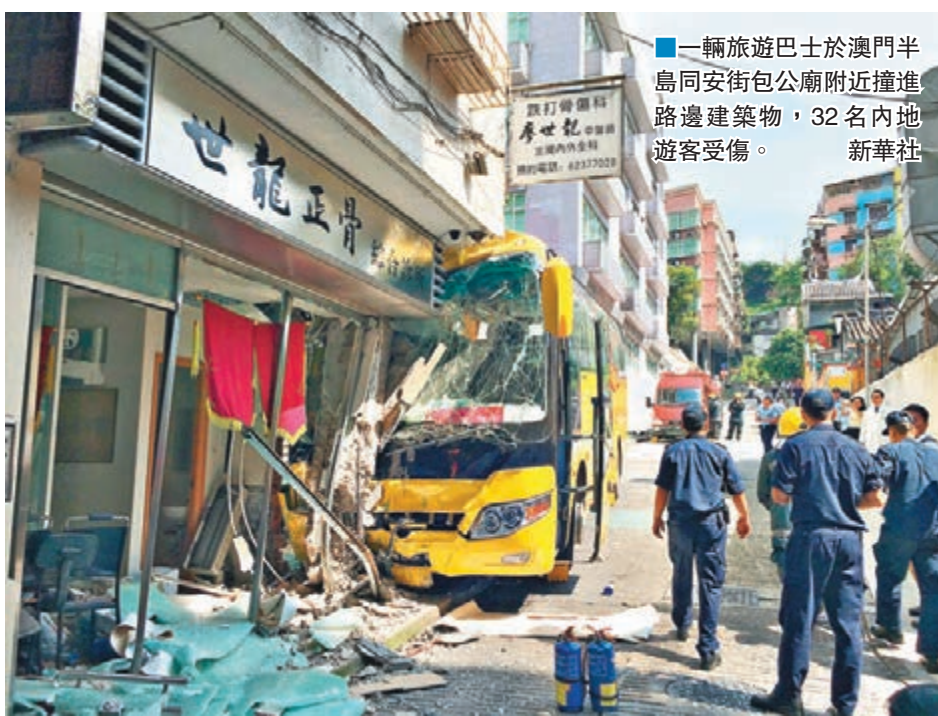
一輛旅遊巴士於澳門半島同安街包公廟附近撞進路邊建築物,32名內地遊客受傷。