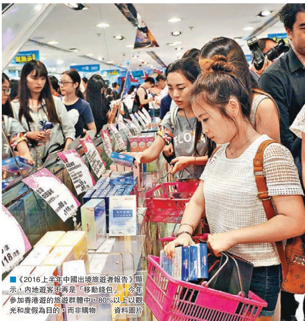
《2016上半年中國出境旅遊者報告》顯示,內地遊客不再是「移動錢包」。今年參加香港遊的旅遊群體中,80%以上以觀光和度假為目的,而非購物。