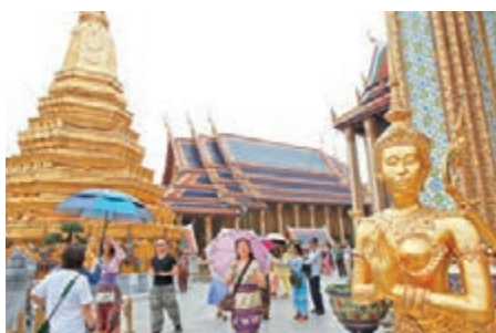
泰國是出境遊旅客的首選。 資料圖片