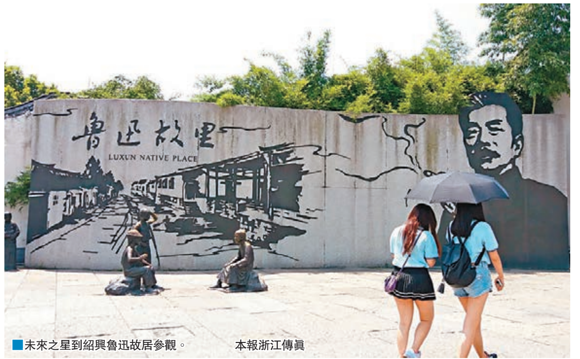
■未來之星到紹興魯迅故居參觀。