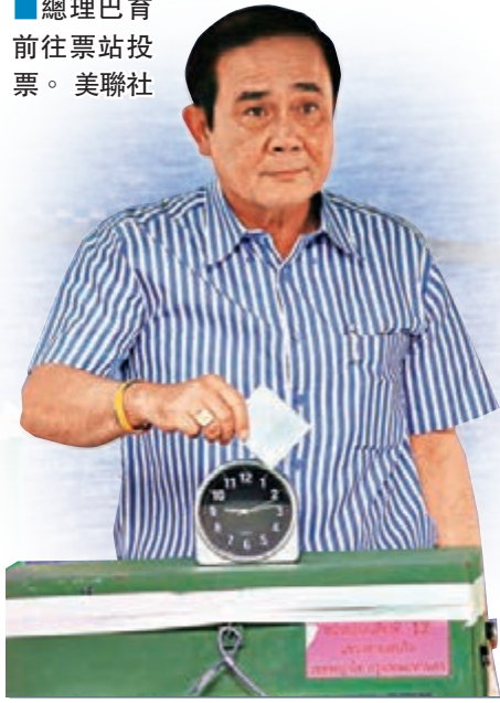
總理巴育 前往票站投票。