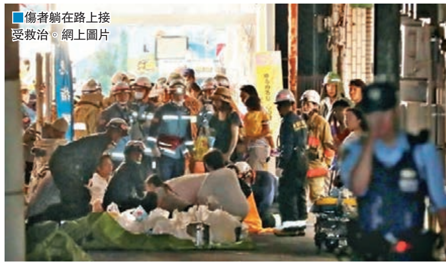
傷者躺在路上接受救治。網上圖片