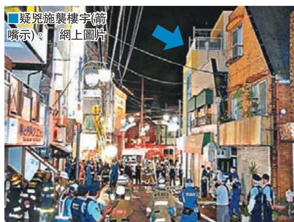
疑兇施襲樓宇(箭嘴示)。