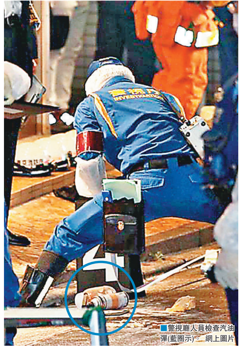
警視廳人員檢查汽油彈(藍圈示)。網上圖片