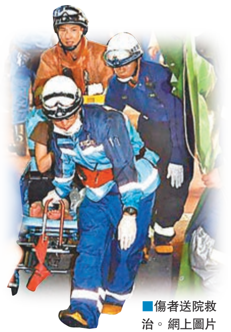
傷者送院救治。

事發時現場正舉行「富士見丘七夕祭典」的巴西森巴舞巡遊，很多一家大小參加，幸事發時巡遊隊伍的中心與現場有一定距離，才沒釀成更大傷亡。一名攜同兒子參與祭典的女子表示，當時巡遊隊伍正演奏音樂，附近突然冒起3至4米高的煙霧，音樂隨即停止，「因為距離較遠，當時我還不知道發生什麼事，只見救護車來了，主辦單位也宣佈取消祭典。」另一名56歲男子則稱，他當時目睹商店街附近冒煙，人們神色慌張，他事後到場察看，發現地上有玻璃碎。