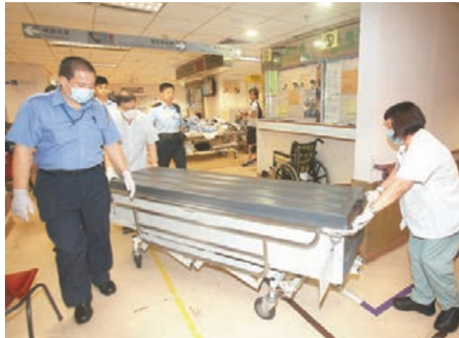
疑遭扼斃妻子遺體早送殮房，待驗屍確定死因。

上月30日早上7時許在荃灣石圍角郵石桃樓17樓一單位亦發生倫常命案，姓伍(52歲)婦人，疑因感情及被禁止外出問題與姓唐(87歲)丈夫發生激烈爭執，有人以菜刀狂斬丈夫逾10刀，再衝出廚房由窗口跳樓，飛墮樓下花槽當場死亡，受傷丈夫送院救治，情況嚴重。