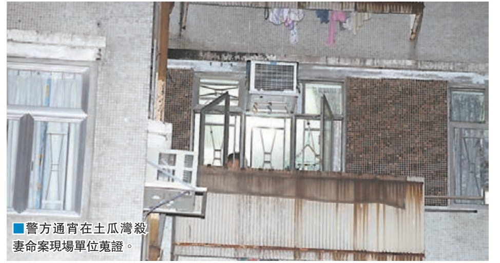
警方通宵在土瓜灣殺妻案現場單位蒐證。