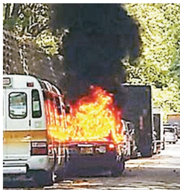
的士遭易燃液體燒至火光熊熊。

香港文匯報訊(記者 杜法祖) 屯門良景邨昨發生怪乘客火燒的士事件。一名男子乘的士抵埗後聲稱不夠錢付車資，由司機陪同上樓找親友幫忙未果，折返後不由分說在車廂遺下疑為天拿水的易燃液體並點火，導致的士起火。縱火怪乘客打開車門逃遁，終被司機和途人合力擒獲，交到場警員帶署扣查。事件中的士慘遭嚴重焚毀，司機無奈慨嘆：「家陣都唔知點算。」