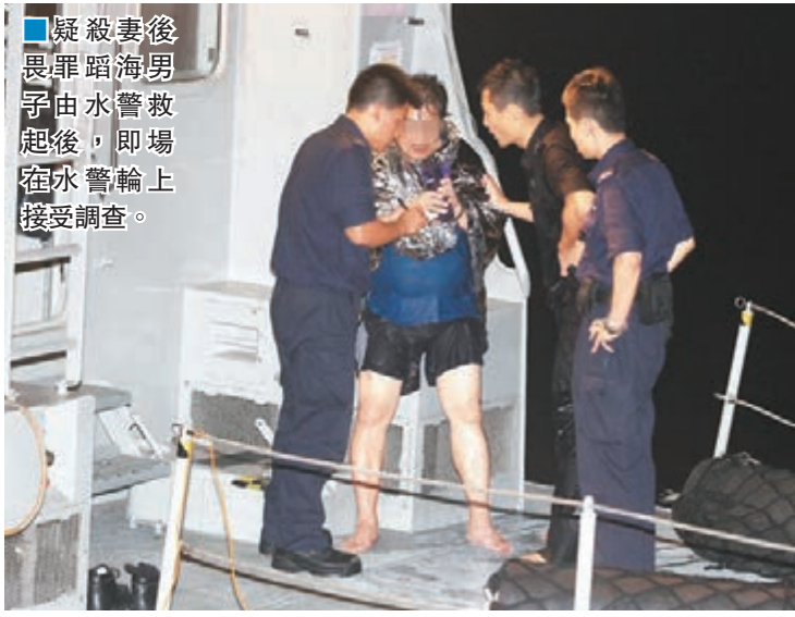
疑殺妻後畏罪跳海男子由水警救起後，即場在水警輪上接受調查。

香港文匯報訊(記者 鄧偉明、杜法祖) 短短9日又再發生涉及老夫少妻的倫常命案，繼上月30日一名53歲婦人在荃灣寓所以菜刀斬傷87歲丈夫墮樓身亡後，昨深夜在土瓜灣炮仗街一單位，一對年齡相差19載的老夫少妻，疑為分居問題爭執，有人竟徒手監生將妻子扼死。約3小時後警方在尖沙咀海面救起一名60歲男子，證實就是女死者的丈夫，不排除有人犯案後畏罪跳海企圖自殺，疑人涉「謀殺」被捕扣查。