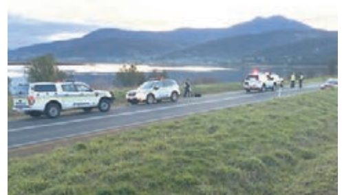
Boyer Road吸引遊人落車拍照，不時釀成車禍。

香港文匯報訊(記者 杜法祖) 繼有港人家庭在日本自駕遊遇上車禍，造成一家四口1死3傷意外後，前日再有一名港人在澳洲旅遊期間被車撞倒重傷，經送當地醫院救治後情況危殆，中國駐墨爾本總領事館人員亦已聯絡有關醫院，促請院方全力救治，另本港入境處亦正按當事人家屬意願，提供一切可行協助，積極跟進事件。