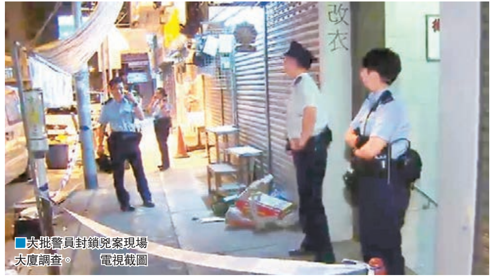
大批警員封鎖兇案現場大廈調查。

兇案現場在炮仗街58號至66號德寶大廈4樓一單位，上址住有一三口，包括一對老夫少妻及其正求學的18歲女兒。女死者姓唐(41歲)，丈夫姓何(60歲)。消息指，夫婦已婚18年，惟最近婚姻出現問題，正辦理離婚及分居手續。 昨日午夜零時16分，18歲女兒外出歸家，赫見母親被透明膠紙封住口部，昏迷倒臥寓所睡房床上，父親則不知所終。 警員接報到場，證實女事主頸部有被扼過傷痕，眼角亦受傷流血，立即急送廣華醫院搶救，惜已證實死亡。