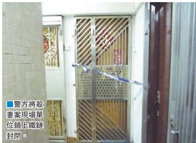
警方將殺妻案現場單位鎖上鐵鏈封閉。