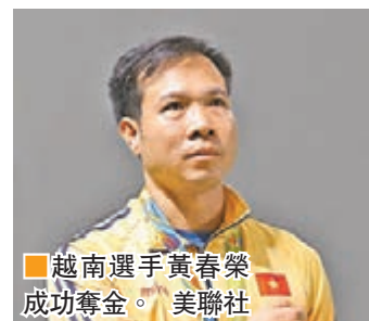
越南選手黃春榮成功奪金。

黃春榮生於1974年，於2000年加入越南國家射擊隊，多次獲得越南國內和東南亞運動會等賽事的獎牌。2012年夏季奧運會上，他在10米氣手槍資格賽中獲得第九，無緣進入決賽，在男子50米手槍決賽中獲得第四，無緣獎牌。