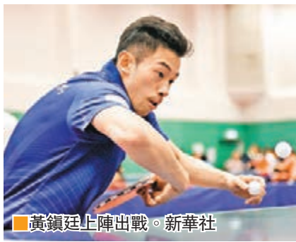
黃鎮廷上陣出戰。