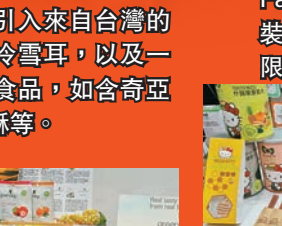
果仁品牌 Toms Farm x 梳乎蛋贈品裝，內有多款口味連限量版匙羹。 煤氣公司引入的 Hello Kitty Green Living 有機食品

麵食類 今年麵食如往年一樣，購買一定數量的麵食，送購物車、旅行袋外，還好像多了以醬油配以即食麵類，以及新口味如出一丁全新九州濃湯豬骨湯味棒子麵等。 壽桃全新「撈米線」，共有兩款口味，以及港式撈車仔麵，符合香港大眾化口味。 日清新產品 新加坡青咖喱米粉