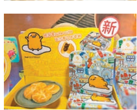
大號冰皮玲瓏九星月餅 榮華限定梳乎蛋豆沙栗子老婆餅

餅食類 筆者在今屆預覽會看到不少新登場美食，在餅食類方面，尤其是月餅，今年在冰皮上，內餡加添了新口味，如榴槤芝士、肉桂蘋果、軟心奶黃等。 美心 Stars War 流心朱古力月餅及奶黃月餅