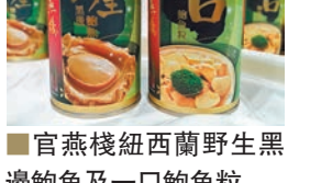
官燕棧紐西蘭野生黑邊鮑魚及一口鮑魚粒

湯飲類 除了食品外，其實近年香港人注重多了飲料的成份，健康飲料應運而生。 源田健康飲品