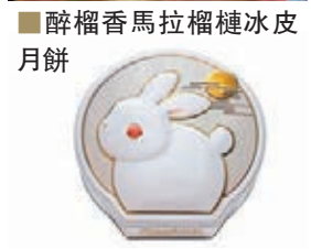
醉榴香馬拉榴槤冰皮月餅 奇華精選迷你月餅禮盒，內有余仁生陳皮豆沙月餅

零食類 別以為零食只有薯片等，其實今年有不少外國的參展商帶來了他們的特色零食，不少還是健康的「零食」，這些零食可以當作手信。 恒興行引入來自台灣的阿里山種冷雪耳，以及一系列台灣食品，如含奇亞籽的海纖酥等。 Greenday 健康零食