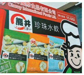
超力原裝韓國進口的熊井珍珠水餃系列

由於香港人生活忙碌，今年發現不少即食的食品，就連鮑魚都有推出即食系列，另外亦有不少容易烹煮的食物。