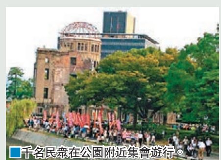
■千名民眾在公園附近集會遊行。

日本廣島和平紀念公園昨日舉行原爆71周年紀念儀式，首相安倍晉三及來自91個國家和歐盟的代表出席。約1,000名日本各地民眾在公園附近