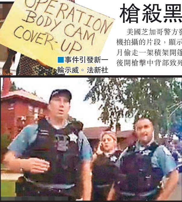
■事件引發新一輪示威。