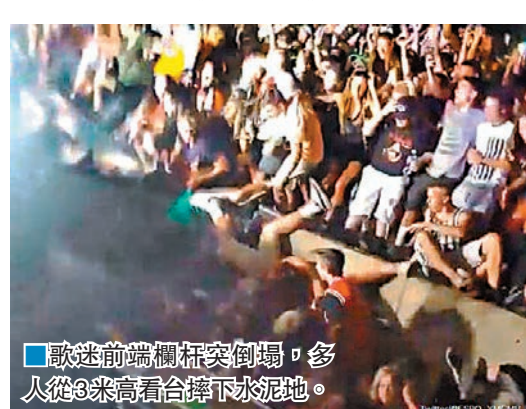
■歌迷前線欄杆倒塌，多人從3米高看台摔下水泥地。