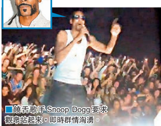
■饒舌歌手Snoop Dogg要求觀眾站起來，即時群情洶湧。

美國有線新聞網絡(CNN)報道，有42人被送至鄰近醫院治療。事發現場外的停車場設立臨時急救區。 ■《每日鏡報》/美國全國廣播公司