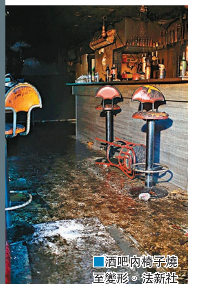
■酒吧內椅子燒至變形。