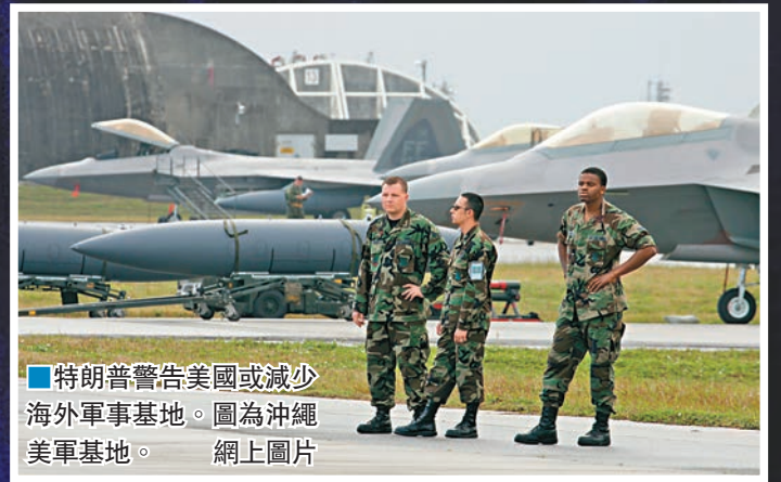
■特朗普警告美國或減少海外軍事基地。圖為沖繩美軍基地。