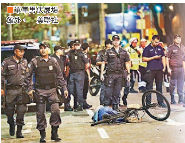
單車男伏屍場館外。

里約奧運開幕禮結束數小時後，一名男子昨日凌晨懷疑踏單車期間被人開槍射殺，倒斃馬拉簡拿球場外。大批警員接報到場，用毛毯覆蓋屍體，暫未知死者身份。