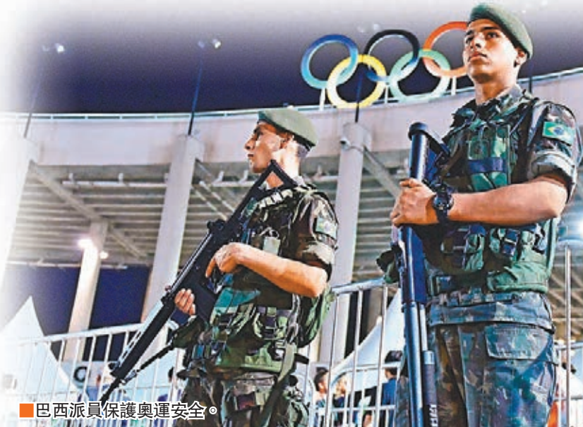
巴西派員保護奧運安全。