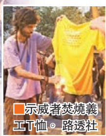
示威者焚燒義工 T 恤。

奧運開幕前，約 3,000 名民眾在舉行開幕禮的馬拉簡拿球場外示威，不滿當局因進行奧運工程遷徙貧民，並要求代總統特默下台。其後部分示威者焚燒巴西國旗及奧運義工 T 恤，並企圖走近球場，警方施放催淚彈及閃光彈驅散，並拘