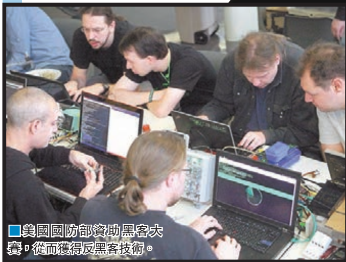
美國國防部資助黑客大賽,從而獲得反黑客技術。

美國國防部先進研究項目局(DARPA)3年前資助舉辦「網絡大挑戰」(CGC)比賽,希望研製特別程式,教導電腦自動發動與抵禦網絡攻擊。比賽前日有結果,由8名美國電腦專家研製的「破壞」(Mayhem)程式,成功脫穎而出,有望奪得200萬美元(約1,551萬港元)獎金。