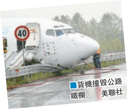
貨機撞毀公路鐵欄。