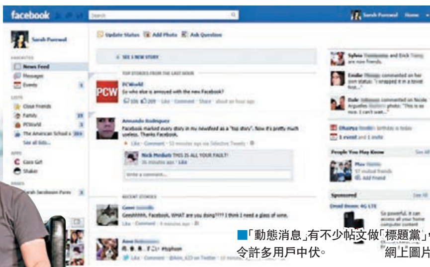
「動態消息」有不少帖文做「標題黨」,令許多用戶中伏。網上圖片