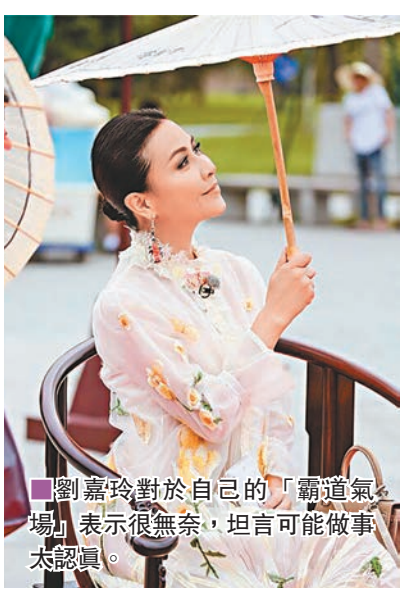
劉嘉玲對於自己的「霸氣氣場」表示很無奈，坦言可能做事太認真。

香港文匯報訊(記者胡若璋廣州報道)作為內地真人秀《我們來了》的「霸氣擔當」，劉嘉玲每一次出場自帶的「劉總」範，總是讓許多人對她畏懼幾分。對此，大呼無奈和不解的劉嘉玲首次用微信的方式接受了記者的採訪，在聊天過程中，劉嘉玲更甜蜜自曝和偉仔日常私下的生活中，還是會定期浪漫一下。 而近期被捕捉到在颱風來臨前，老公梁朝偉前往超市購買生活調料，觀眾都希望劉嘉玲這裡求證偉仔原來