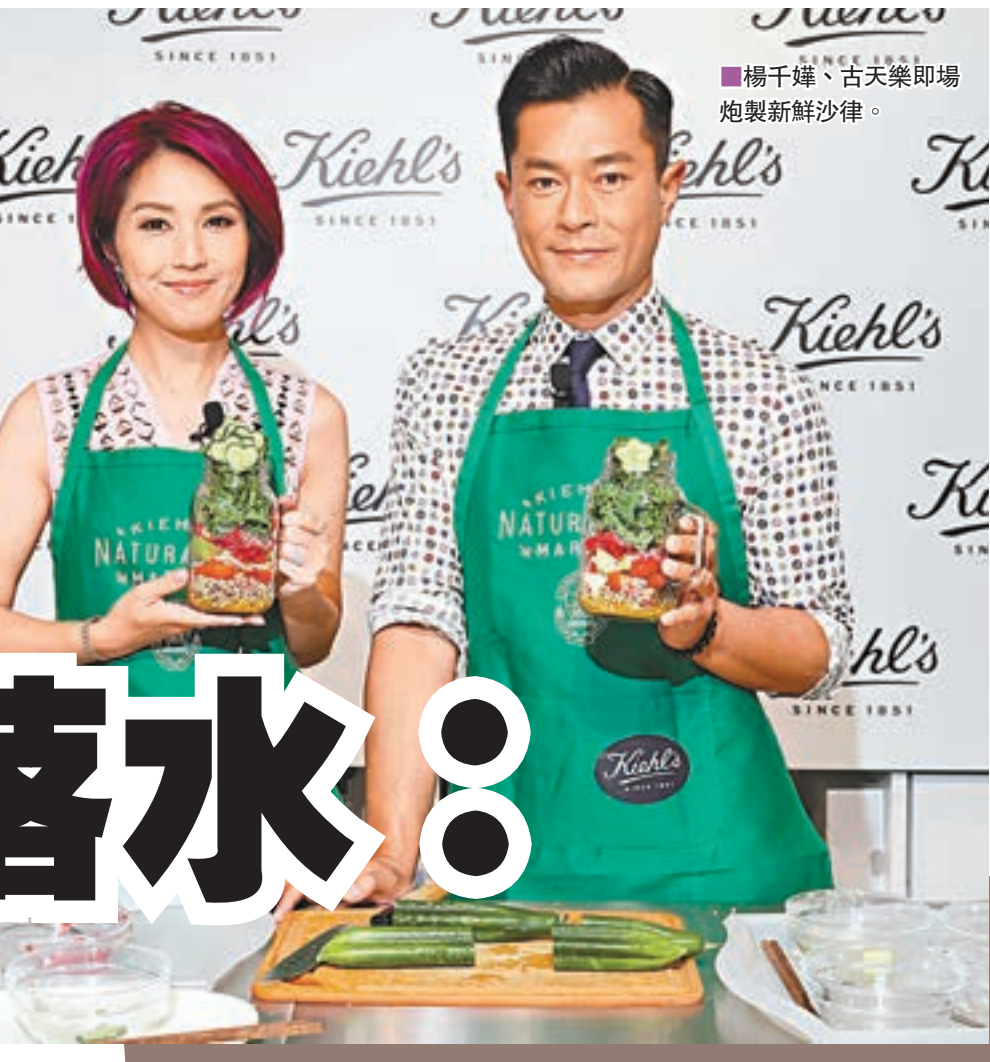
楊千嬅、古天樂即場炮製新鮮沙律。