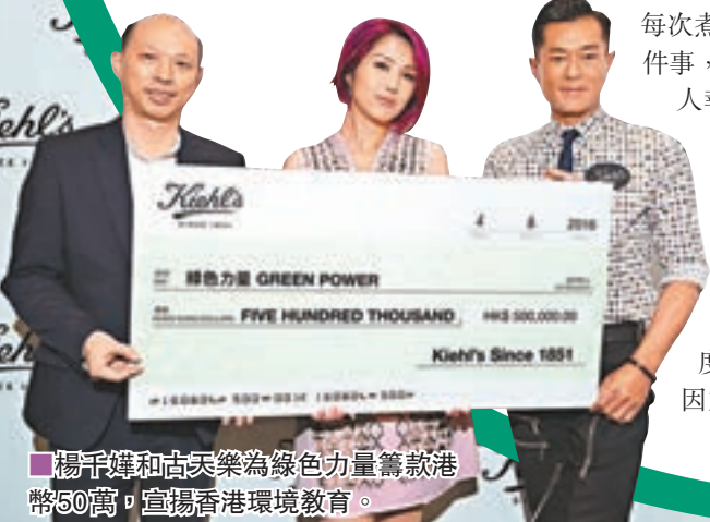
楊千嬅和古天樂為綠色力量籌款港幣50萬，宣揚香港環境教育。