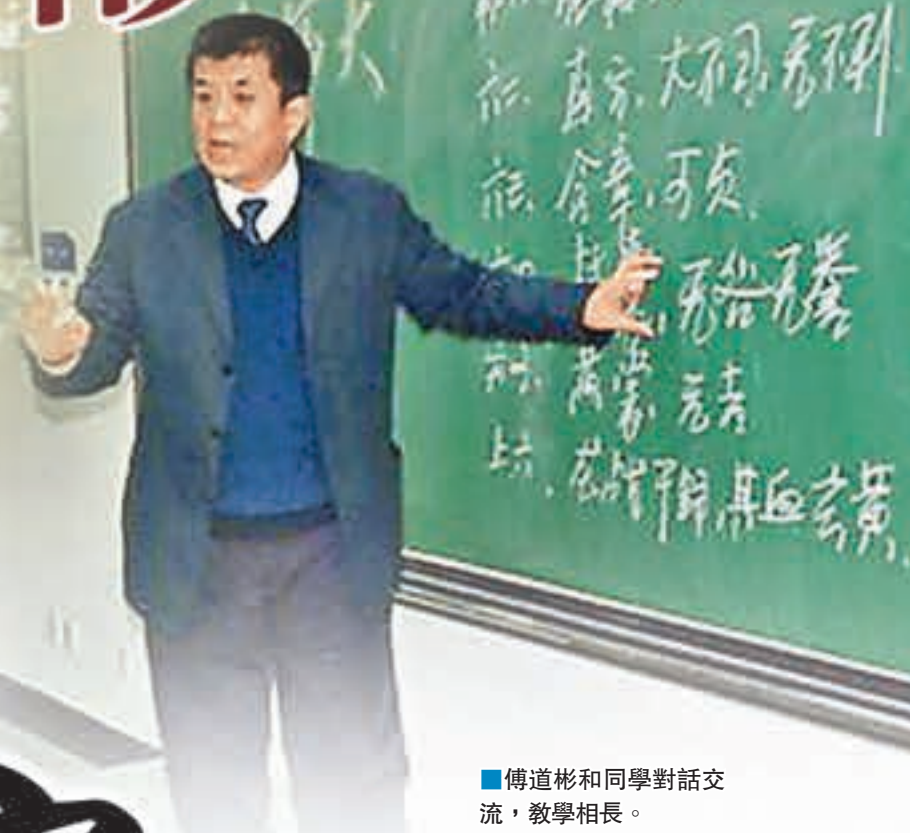
傅道彬和同學對話交流，教學相長。

作為中國古典文學的起源，先秦兩漢文學無疑是中國最早期文學領域中內容最為艱深、思想最為精深的經典，在文學研究中一直處於冷門地位。但卻有這樣一人，集注重傳承的學者、精於鑽研的師者、喜之愛之並發揚於多種藝術形式的官者於一身，執著地投身於這一領域，堅守着中國古代文化經典，他就是現任黑龍江省文聯主席、黑龍江省文學學會會長，中國先秦兩漢文學會常務副會長傅道彬。