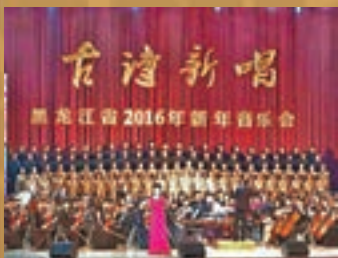
「古詩新唱」2016年新年音樂會。

現任哈爾濱師範大學副校長、漢語言文學學科帶頭人，首都師範大學特聘教授、博士生導師，黑龍江省文聯主席、黑龍江省文學學會會長，中國先秦兩漢文學會常務副會長。先後出版《詩可以觀》、《晚唐鐘聲》等著作。主編了《中國古典才子佳人小說》、《錢基博學術文選》等著作，在《中國社會科學》、《文學評論》、《新華文摘》等期刊發表逾百篇論文。