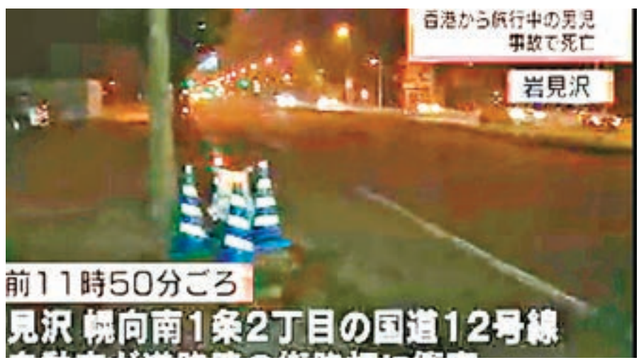
港人4口家到日本自駕遊，在岩見澤市一條國道失控撞及路旁燈柱釀成慘劇。

香港文匯報訊 (記者 杜法祖) 一個港人4口家庭前日在日本北海道自駕遊時不幸發生車禍，釀成一死三傷悲劇。據當地傳媒報道，死者是一名在私家車後座的3歲男童，他因腰腹重創不治，其同車父母及胞弟則受傷，但均無性命危險。中國駐札幌總領事館人員事發後迅速趕到醫院探望傷者，而入境處昨日派員陪同肇事家庭親友飛抵當地善後。當地警方仍在調查意外原因。