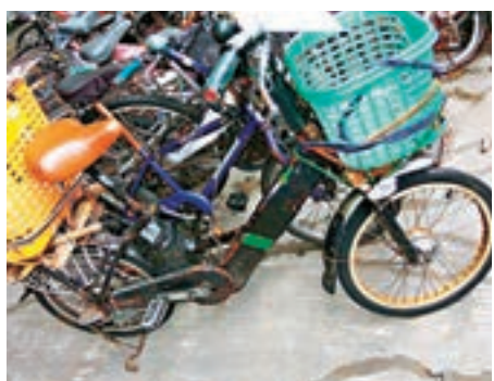
警方截獲的非法改裝電動單車。

香港文匯報訊 (記者 杜法祖) 西九龍總區交通部特遣隊人員昨午12時許經太子道西近高打老道時，發現一輛行駛中的單車並非用人力腳踏推動，懷疑有人駕駛非法改裝電動單車，於是上前截停調查。 經初步檢驗後，證實該單車可由電動機推動，警員遂將該名駕駛單車的男子拘捕，警員並揭發有人欠交法庭罰款而被通緝。