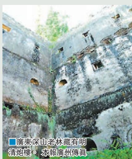
廣東深山老林藏有明清炮樓。本報廣州傳真