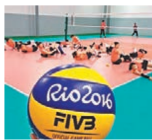
中國女排到比賽場館踩場。