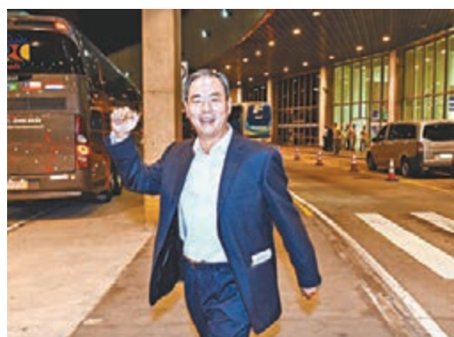
中國體育代表團副團長蔡振華。