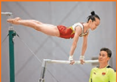
中國女子體操隊在臨時館內訓練了三個多小時。