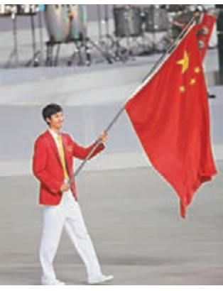
雷聲曾於亞運開幕式手持國旗入場。

昨日，參加里約奧運會的中國代表團要在奧運村舉行升旗儀式，按照慣例，儀式之後就要揭曉中國代表團開幕式旗手人選的懸念。本報記者率先從包括廣東省體育局等多部門確認，這個位置已經確定由雷聲擔任。事實上，雷聲成為奧運旗手並不算「爆冷」。2013年的全運會，雷聲就壓過易建聯成為廣東代表團的開幕式旗手。2014年仁川亞運會上，雷聲又成為中國代表團旗手。