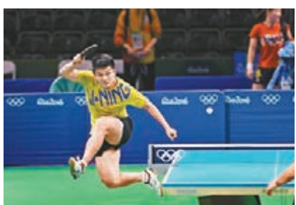
國乒隊員加緊訓練。

昨日，內地媒體《中新社》記者探營在里約會展中心訓練的中國乒乓球隊。當日，中國隊與老對手德國隊同場訓練。作為中國奧運軍團最早抵達巴西的隊伍之一，中國乒乓球隊已經在里約訓練了長達近2周時間。「中國隊的實力還是最強的。」國乒總教練劉國梁說，抵達里約後，國乒隊員就馬上投入到訓練之中，目前無論是對場地，還是時差都有了很好的適應，中國隊每名隊員都達到了教練組預期的狀態和水準。