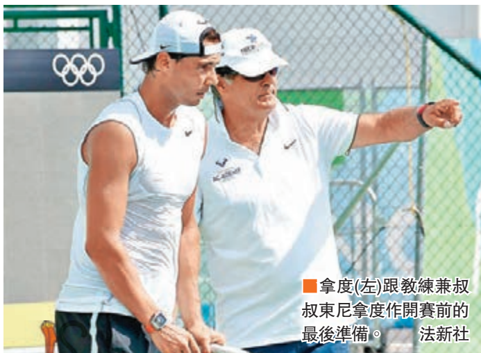
拿度(左)跟教練兼叔叔東尼拿度作開賽前的最後準備。

儘管有傷在身，西班牙網球名將拿度的奧運之旅沒有「縮水」，他在南美時間2日最終決定參加里約奧運會網球單打、雙打、混雙三個項目的比賽。