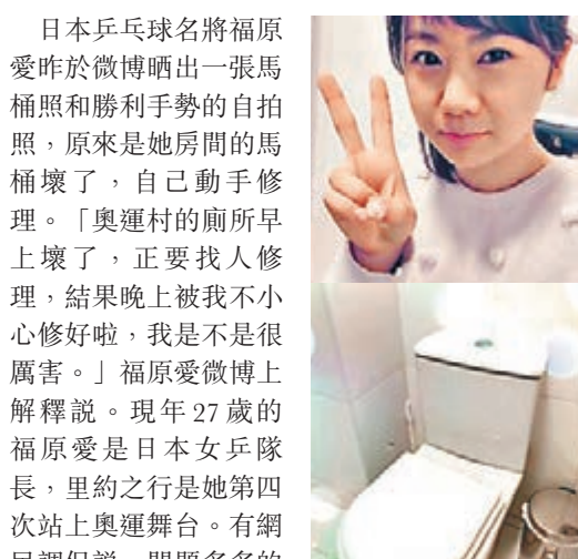
福原愛修理完馬桶做出勝利手勢。

日本乒乓球名將福原愛昨於微博晒出一張馬桶照和勝利手勢的自拍照，原來是她房間的馬桶壞了，自己動手修理。「奧運村的廁所早上壞了，正要找人修理，結果晚上被我不小心修好啦，我是不是不厲害。」福原愛微博上解釋說。現年27歲的福原愛是日本女乒隊長，里約之行是她第四次站上奧運舞台。有網民調侃說，問題多多的里約奧運村是個可讓運動員學會家政維修的培訓基地。