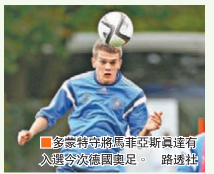
多蒙特守門員馬菲亞斯真達有入選今次德國奧足。