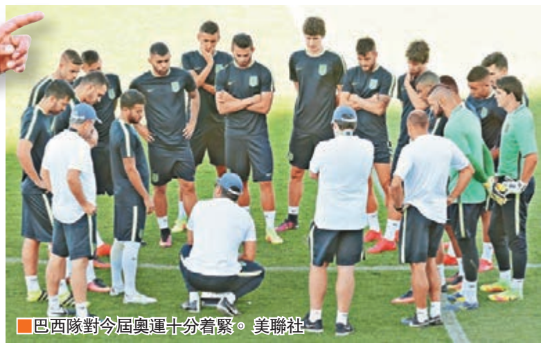
巴西隊對今屆奧運十分著緊。

巴西近年國際大賽成績平平，足球王國的地位備受挑戰，舉國上下均希望尼馬可帶領巴西足球