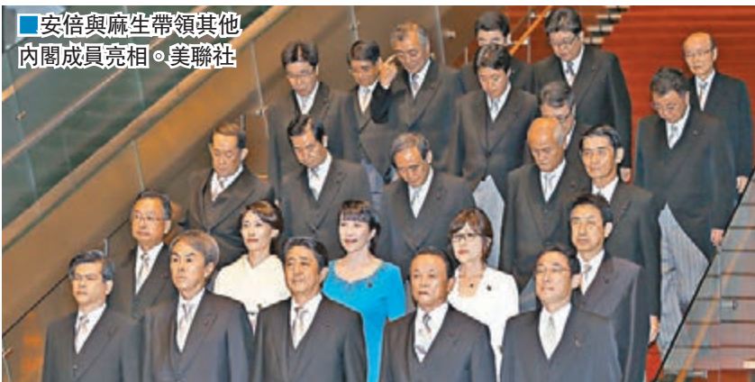
■安倍與麻生帶領其他內閣成員亮相。