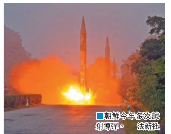
■朝鮮今年多次試射導彈。