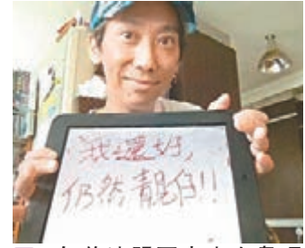
4年前達明不幸患上鼻咽癌。

聲明中又透露二人已分開居住一段時間，已漸漸適應這種狀態，覺得也是時候告訴朋友們。至於一對子女，他們會以友愛的態度共同教養。聲明末又表示希望媒體、記者朋友可以給予二人私人空間，暫時不追訪。