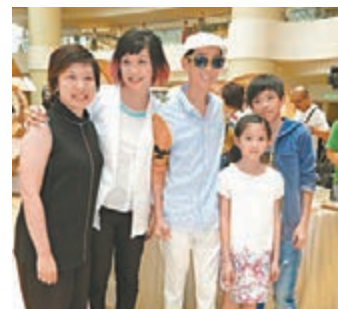
2014年，張達明帶同一對子女搭太太(左二)場。