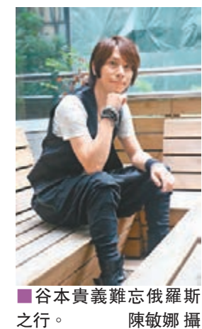
谷本貴義難忘俄羅斯之行。

香港文匯報訊 (記者 陳敏娜) 日本男歌手谷本貴義第3度訪港，出席前晚在動漫節舉行的Heartbeat青年音樂祭，熱唱首本名曲。開騷前，他接受本報訪問，謂擔心會因掛8號風球而要取消演出。他透露5、6年前在美國演出完畢搭機返日時，遇上日本打風，「當時飛機要斜飛，不能正常降落，連試了3次才成功著陸，連飛行時間共坐了24小時飛機。」