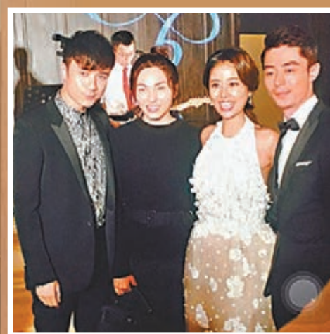
古巨基和太太飛去台灣飲心如喜酒。