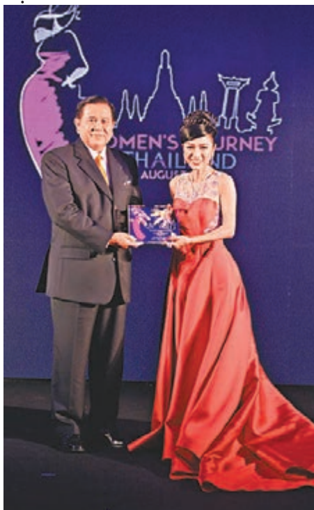
米雪在泰國獲大獎。

香港文匯報訊 泰國政府昨晚於曼谷舉行世界女士成就頒獎典禮，邀請了18位來自不同地方並對泰國有莫大貢獻的女性到場接受獎項。而一直以來對泰國情有獨鍾的米雪不時向外推廣當地之美，去年炸彈案件後更親身到四面佛前獻舞，積極推動泰國旅遊業，故獲頒發世界女性成就獎，同時亦是唯一一位香港演藝界代表，認真驚勢！