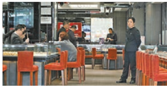
零售市道繼續疲弱，珠寶店生意大減。

香港文匯報訊（記者 文森）零售寒冬仍未回暖，政府統計處昨日發表最新零售數據顯示，本港零售業總銷貨價值為337億元，按年下跌8.9%，連跌16個月，跌幅較5月擴大0.6個百分點；零售業總銷貨數量則按年跌9.6%。總結今年上半年情況，總銷貨價值按年下跌10.5%；總銷貨數量按年下跌10.1%。政府發言人指出，數據反映訪港旅客消費減少及市民消費意欲趨趨審慎。有經濟專家認為，零售市道會持續疲弱，料全年出現高單位數字收縮。