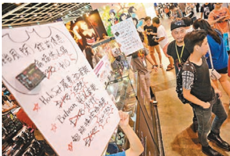
動漫節來到最後一天，參展商紛紛割價促銷。

有人歡喜有人愁，亦有參展商表示銷情不理想，售賣日本動漫周邊產品的公司 Rainbowbox 前日風暴來襲時，已將部分產品以「蝕本打風價」標示，負責人陳小姐表示，有關產品以割價約半的成本價出售。她又指本屆展覽人流雖然與上年相若，但顧客花錢不如以往豪爽，要「認過度過」，消費力較以往弱，她估計總銷售額按年下跌約20%。