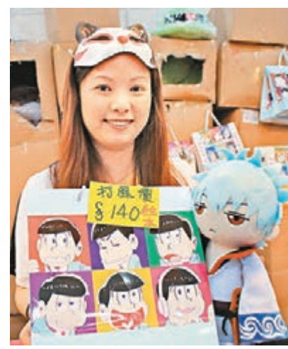
部分攤檔推出打風價。