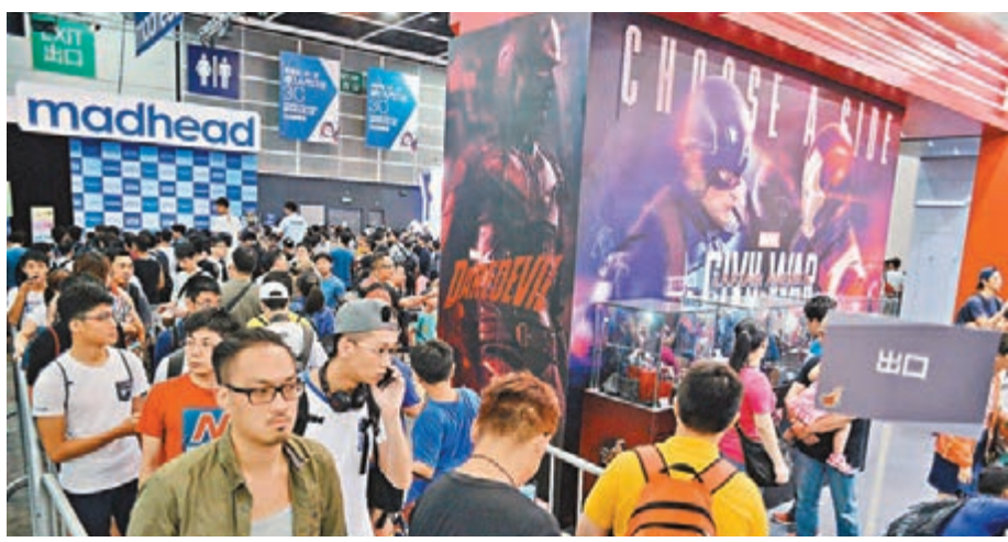
颶風下的動漫節仍有不少人排隊。

香港文匯報訊（記者 莊禮傑）颶風「妮妲」襲港，本年首個八號風球令本屆香港動漫電玩節的最後一個展覽日只剩下半天，但風雨未對部分參展商的銷售額帶來顯著影響，有電子遊戲商的預購名額於昨日更比以往快一半時間爆滿，估計總銷售額按年增長5%，但亦有參展商認為銷情欠佳，要以割價約一半的「蝕本打風價」促銷。