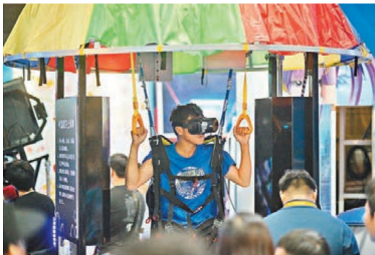
VR裝置成為今年的熱門產品。

昨日天文台於下午12時40分改掛三號強風訊號，動漫節主辦單位即因應早前的安排，宣佈展覽於下午2時40分起開放。 約千名市民在位於灣仔會展的展館外排隊等候入場，龍尾更一度延至會展外的博覽道。展覽依時開放，市民魚貫入場，部分攤位更出現排隊入龍。