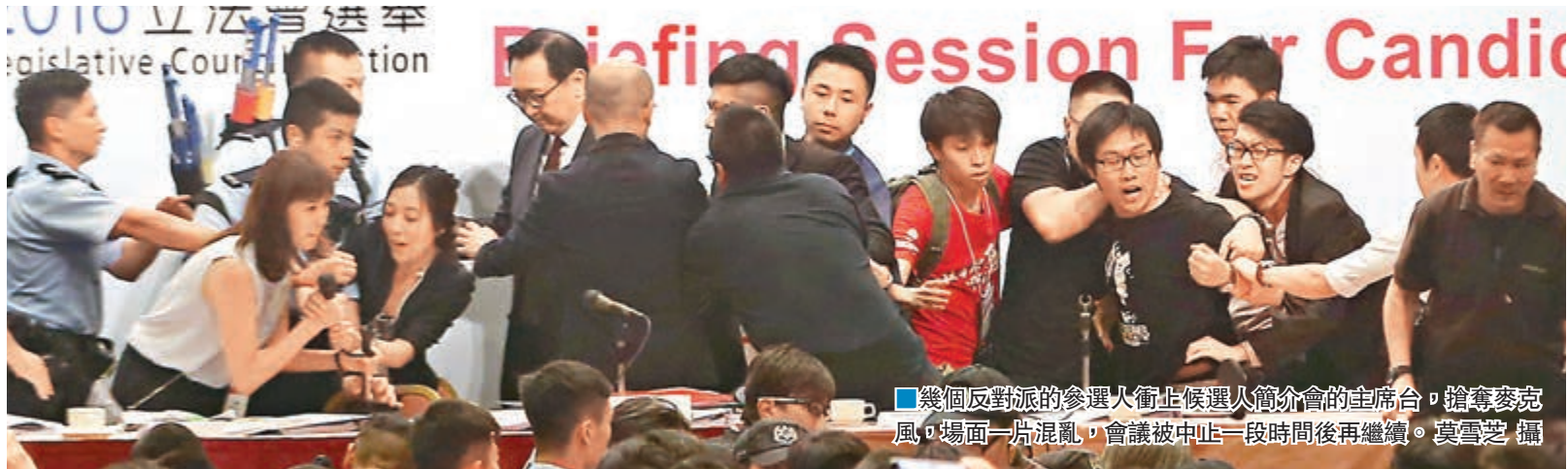
幾個反對派的參選人衝上候選人簡介會的主席台，搶奪麥克風，場面一片混亂，會議被中止一段時間後再繼續。

選管會其後發新聞稿表示，簡介會期間，有人擾亂秩序、大聲叫嚷、衝上講台搗亂，嚴重影響會場秩序，令簡介會中斷，最終簡介會需提早完結，以便選舉主任可就候選人在選票上的排名次序進行抽籤。選管會對該些人的暴力行為表示極度遺憾，同時予以強烈譴責。