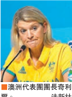
澳洲代表團團長奇利爾。

澳洲代表團團長奇利爾當地時間31日表示，在29日奧運村裡他們的住宿樓發生火情時，有人趁他們下樓避險之際偷走了一台筆記本電腦和幾件上衣。奇利爾說，這次失竊事件讓他們對奧運村的安表示擔憂：「當你(在奧運村裡)有15,000張床時，你會有許多人在村裡閒逛。我不是在控訴任何人，但村裡有許多非註冊人員，比如工人、保潔員、維修工等，很不幸，盜賊幾乎難以避免。」 ■新華社