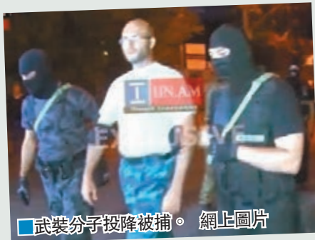
武裝分子投降被捕。

亞美尼亞國家安全局日前宣佈，佔據首都埃里溫警察局長達兩周的20名武裝分子已經投降，隨即被捕。雙方對峙期間多次放火，導致兩名警察死亡，雙方互有受傷。