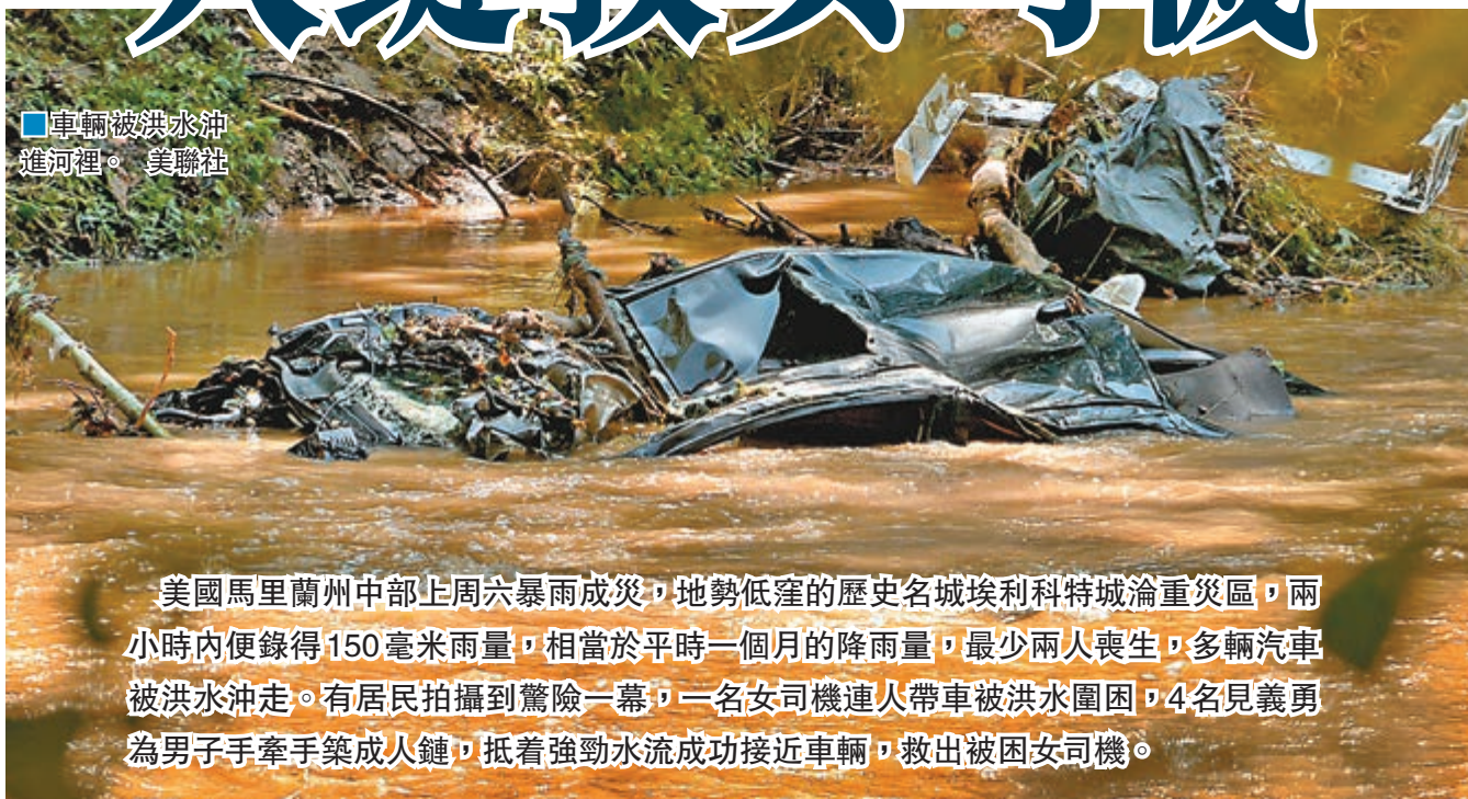
車輛被洪水沖進河裡。

美國馬里蘭州中部上周末暴雨成災，地勢低窪的歷史名城埃利科特城淪重災區，兩小時內便錄得150毫米雨量，相當於平時一個月的降雨量，最少兩人喪生，多輛汽車被洪水沖走。有居民拍攝到驚險一幕，一名女司機連人帶車被洪水圍困，4名見義勇為男子手牽手築成人鏈，抵着強勁水流成功接近車輛，救出被困女司機。