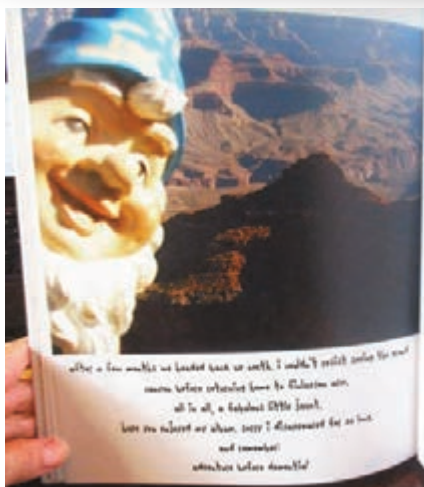
利奧波德曾遊覽大峽谷。