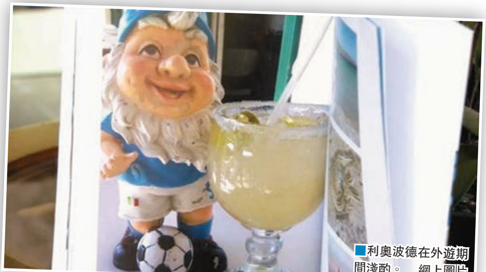
利奧波德在外遊期間淺酌。