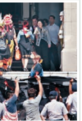
■ 蔡英文(後右二)在「總統府」大門外迎接少數民族代表。