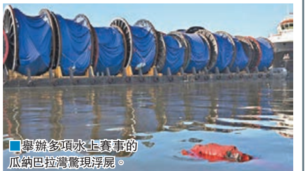
舉辦多項水上賽事的瓜納巴拉灣發現浮屍。