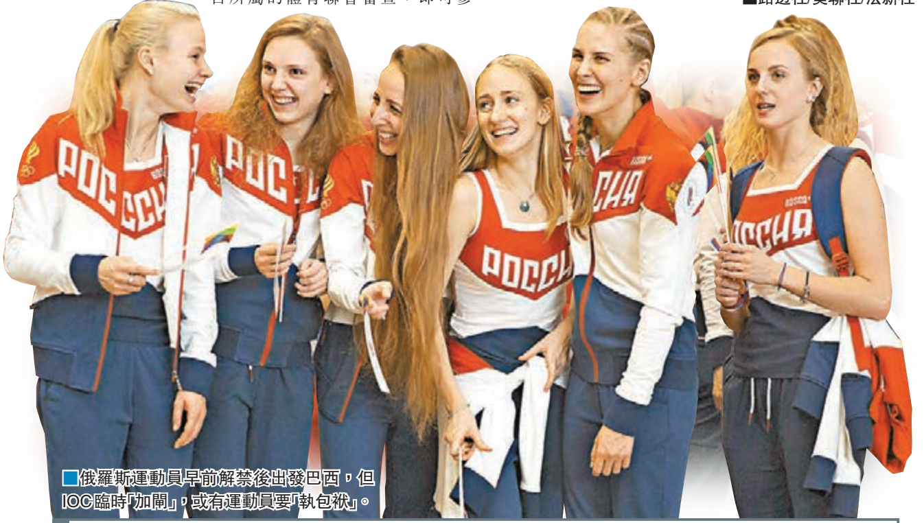
俄羅斯運動員早前解禁後出發巴西，但IOC臨時「加閘」，或有運動員要「執包袱」。