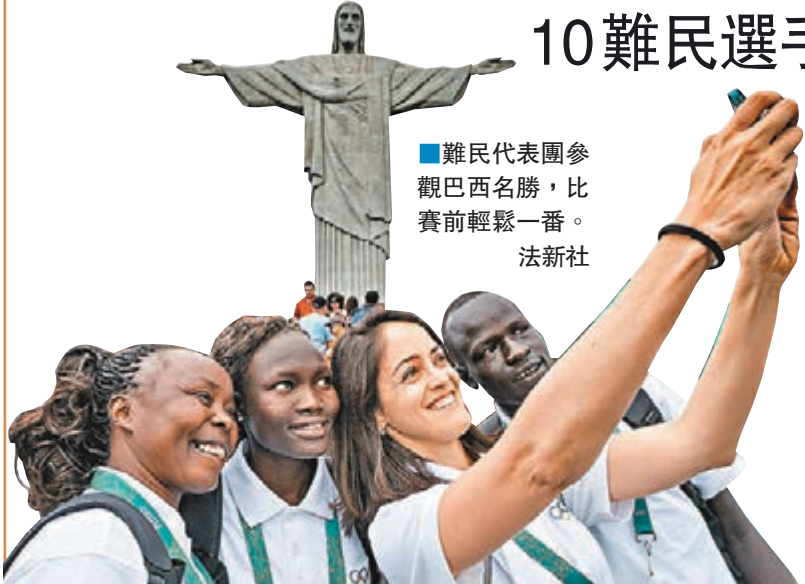
難民代表團參觀巴西名勝，比賽前輕鬆一番。

今屆奧運將是史上首次有難民組隊參加，代表團運動員包括5名南蘇丹難民、2名敘利亞難民、2名剛果民主共和國難民和1名埃塞俄比亞難民。他們將參加游泳、柔道和田徑等項目。