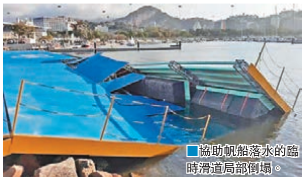
協助帆船落水的臨時滑道局部倒塌。

舉辦多項水上賽事的瓜納巴拉灣水質亦備受關注，早前有傳媒報道該處水面滿佈垃圾、排泄物甚至浮屍。當局採取緊急措施，出動12艘船收集垃圾，並於源頭河流加裝分隔網。