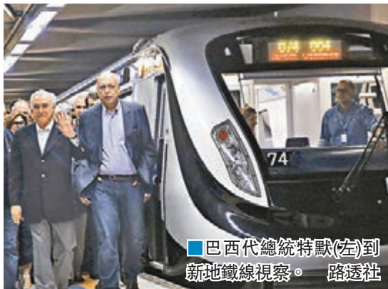
巴西代總統特默(左)到新地鐵線視察。

巴西近年經濟不景，國民對政府大灑金錢舉辦奧運非常不滿，而各項奧運基建延誤不斷，更令民怨不斷積聚。代總統特默前日出席奧運重點基建項目、地鐵4號線延長段通車儀式時，直言「已準備好在奧運開幕典禮上被噓」，但有信心奧運成功舉行，希望體育能連繫國民，一同走出經濟危機。